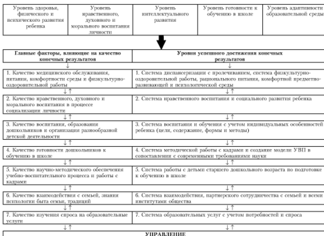
Рисунок 4. Главные факторы управления ключевыми результатами

Управление выделенными ключевыми результатами будет определяться главными факторами (Рис. 4).