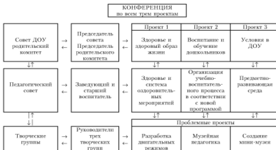
Рисунок 3. Матричная структура внутрисадовского управления

В данной схеме представлены три проекта, над которыми работает ДОУ. Важно, чтобы в каждом из них участвовал не только педагогический коллектив, но и родители воспитанников. Творческие группы создаются под определенную тематику, в состав таких групп должны входить заинтересованные, творческие педагоги. В работе такой группы человека нельзя заставить работать по приказу, люди объединяются по желанию, с целью создать и реализовать что-то новое. Задача творческих групп состоит в более детальной, глубокой разработке одного из разделов проекта. Связующим звеном этой структуры может быть форма представления результатов по всем проектам, например, конференция. Данная структура указывает на особый период работы учреждения - режим развития, изменения содержания и организации педагогического процесса с целью его совершенствования.