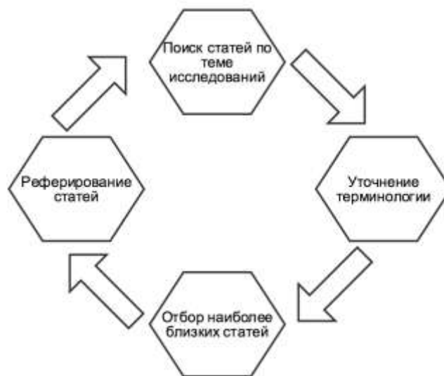
Рис. 1. Этапы работы ученого с научной информацией

Введение. Проблема управления научной информацией, входящей в круг интересов отдельного ученого, была и остается актуальной. Еще в 1945 году в [1] на базе существовавших в то время информационных технологий была предложена модель комплекса управления персональной научной информацией. Концептуальной основой этого комплекса была система ассоциативных связей – прообраз гипертекста, формируемая пользователем при работе с научной информацией. Сегодня наиболее эффективным подходом к решению проблем управления научной информацией, в частности, математической являются семантические технологии, например, [2 – 5]. В результате обработка семантических связей, выполняемая преимущественно в автоматическом режиме, позволяет формировать личное информационное пространство ученого.