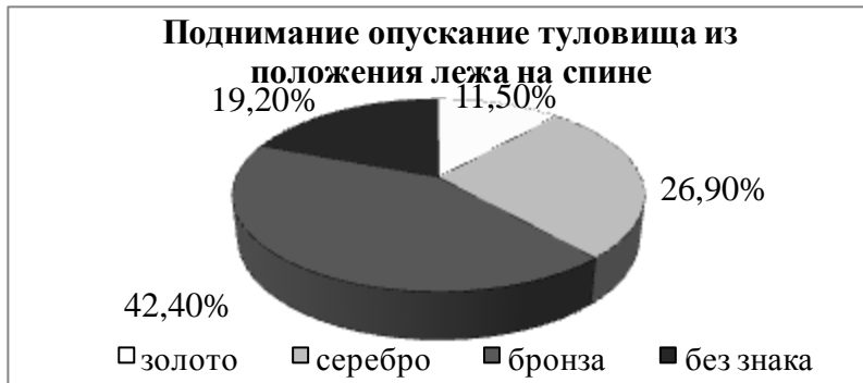
Рис. 4. Процентное соотношение показателей теста «Сгибание и разгибание туловища из положения, лежа на спине» девушек 20-21 года (n=26) с нормами ГТО