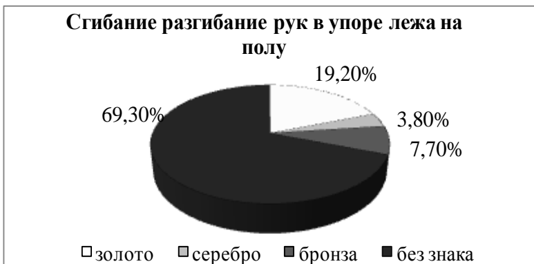
Рис. 2. Процентное соотношение показателей теста «Сгибание и разгибание рук в упоре лежа на полу» девушек 20-21 года (n=26) с нормами ГТО