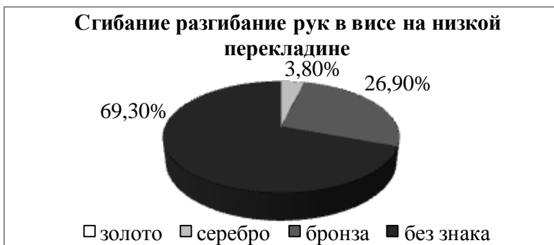
Рис. 3. Процентное соотношение показателей теста «Сгибание и разгибание рук в висе на низкой перекладине» девушек 20-21 года (n=26) с нормами ГТО