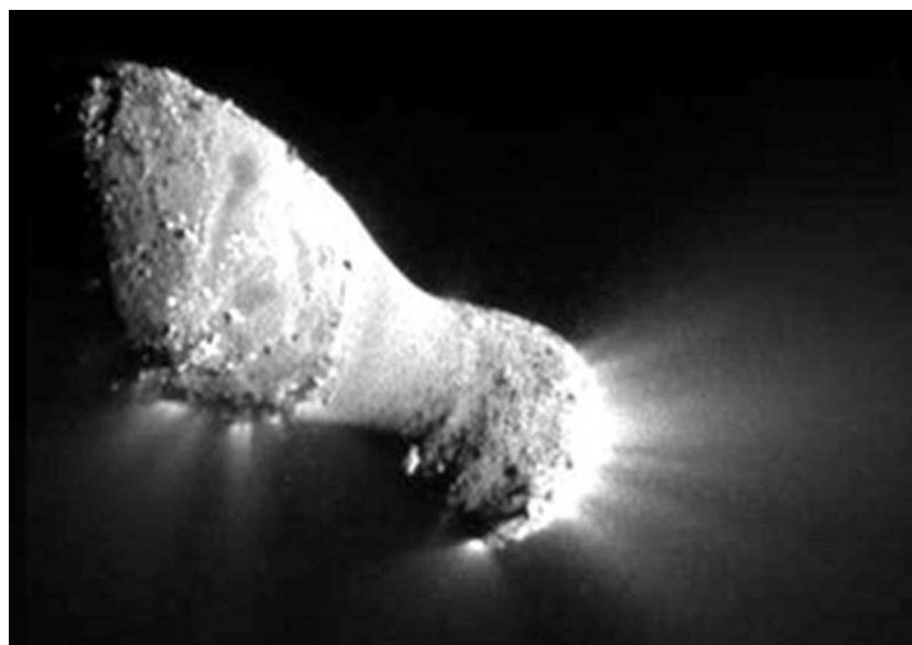
Рис. 2. Гантелевидная форма ядра кометы Хартли 2

Заслуживает особого внимания вопрос, поднятый П. Дженниксом, о связи роя и малой планеты 2004 HW [8]. Этот астероид был открыт группой Кембриджских астрономов как объект с периодом 4.41 года и афелийным расстоянием 4.40 а.е.