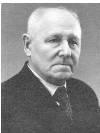
Фото 3. Сергей Иванович Архангельский (1882–1958), член-корреспондент АН СССР (1946), доктор исторических наук, основатель и декан историко-филологического факультета Горьковского государственного университета

Сергей Иванович Архангельский (фото 3) родился 22 января 1882 г. в уездном городе Семёнове Нижегородской губернии в дворянской семье крупного уездного чиновника Ивана Андреевича Архангельского. Сергей Архангельский рано осиротел. Его опекунами и воспитателями стали близкие родственники.