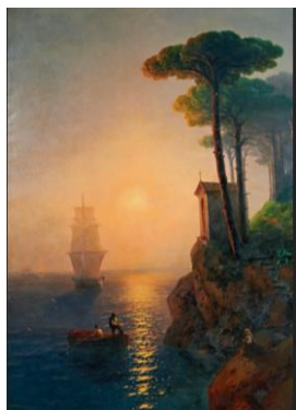
Айвазовский И.К. Туманное утро в Италии, 1864