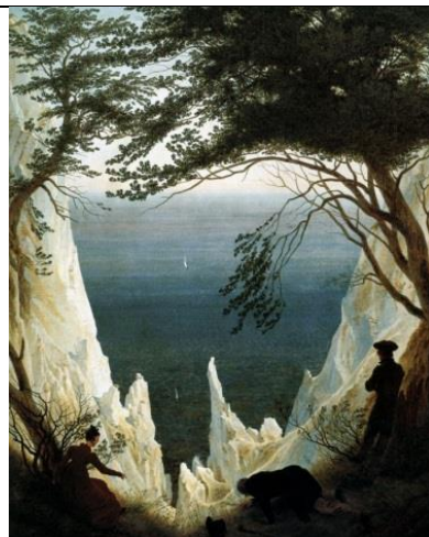
Каспар Давид Фридрих