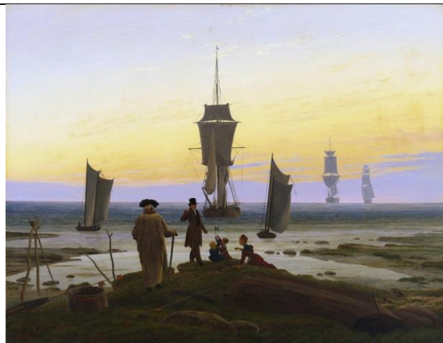
Каспар Давид Фридрих «Этапы жизни», 1835 г.