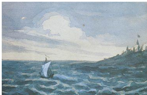
Лермонтов. Акварель. 1828—1831

Парус – есть название как программа (живет только в стихии, на ветру, на свободе; корабль с парусом не зависит от течения, низшего (нет толпы, одиночество), но зависит от высших сил, силы ветра; нет покоя и нет конца странствию). Ассоциативный ряд – море, ветер, ... 1832