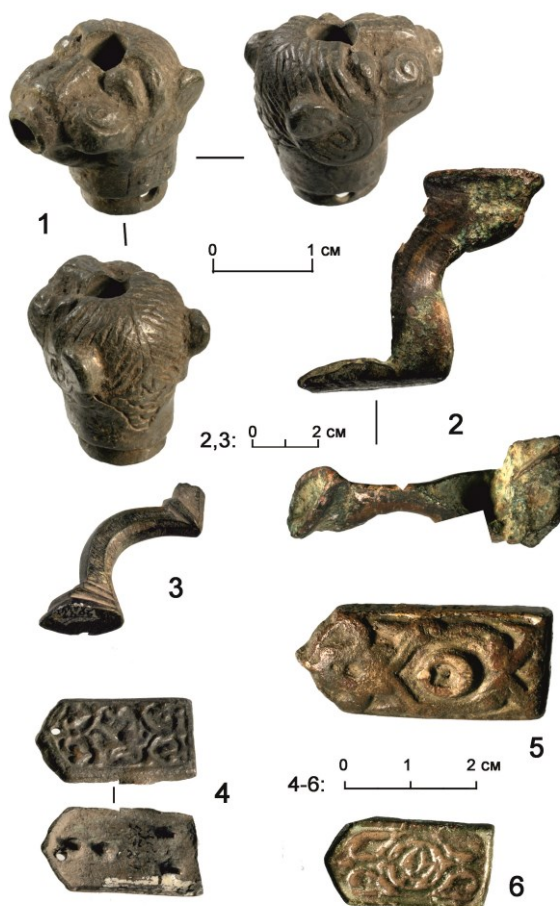
Рис. 3. Металлические детали парадных изделий (1–3) и украшений пояса (4–6). 1–3: Ближний Восток. XI – XII вв. Находки на Билярском городище. Коллекция НМ РТ, инв. № 5427; 4–6: поясные накладки, подражание ближневосточным изделиям XI – XII вв. Находки на Билярском городище. Коллекция НМ РТ, инв. № 5427