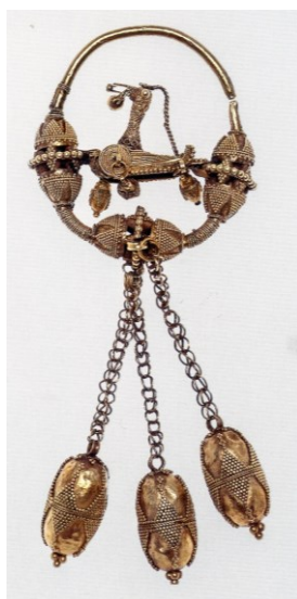
Рис. 4. Височные подвески. Золото, медь, зернь, скань. Волжская Булгария. XI – первая половина XII в. Коллекция Государственного Эрмитажа. Инв. № 506/4 (по [36, с. 411, кат. № 331])

Еще одна категория изделий, которая наличествует в болгарских древностях и имеет, скорее всего, сиро-египетское происхождение, – это шахматные костяные фигурки: ладья, пешка, слон или конь (рис. 5), найденные на Билярском городище [37, с. 74–75, табл. 19:381, 382, 387, 390]. Аналогичные изделия, изготовленные в Сирии или Египте в XI – XII вв., имеются в Музее Исламского искусства (The Museum of Islamic Art) в столице Катара – Дохе [38, cat. no. 100, 102]. Более ранние (IX в.) шахматы из Нишапура, как и из Мавераннахра (IX – X вв.), имеют несколько иную форму [39, р. 274; 36, с. 126–128, кат. № 76].