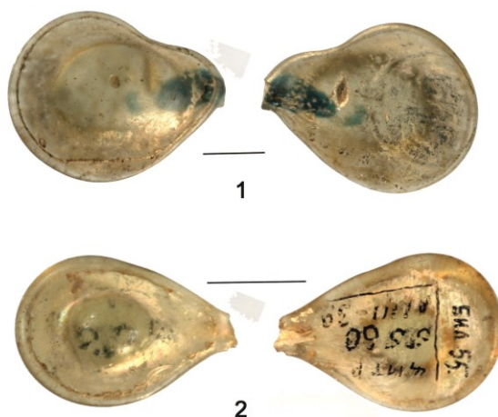
Рис. 2. Фрагменты стеклянных ламп. Сирия или Египет. XI в. Билярское городище. Коллекция НМ РТ, инв. № 5560, Бил-55