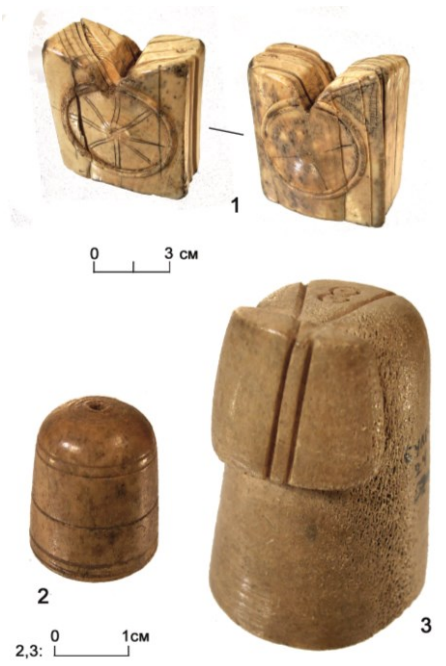
Рис. 5. Шахматные фигуры из кости и рога. Сирия или Египет. XI в. Находки на Билярском городище. Коллекция НМ РТ, инв. № 5427

Отметим, что ассортимент сиро-египетского экспорта к булгарам отличался от направляемого в русские земли. На Руси это были в основном парадные керамические и стеклянные сосуды. В XII – XIII в. сирийские стеклянные изделия встречались на западных русских землях – в Новогрудке, Минске, Слониме, Друцке, Гродно. Это чаще всего кубки с росписью эмалями и золотом с христианскими сюжетами [46, с. 225–227]. Реже они достигали земель Владимиро-Суздальской Руси. Фрагменты нескольких таких сосудов найдены при раскопках во Владимире и Ярославле [47, с. 97]. В Ярославле они находились в сооружении, датированном второй половиной XII – первой половиной XIII в. [47, с. 93]. Несмотря на то что во Владимиро-Суздальской Руси присутствие булгар достаточно хорошо археологически документировано, связывать эти находки именно с их посредничеством по опубликованному материалу нет оснований.