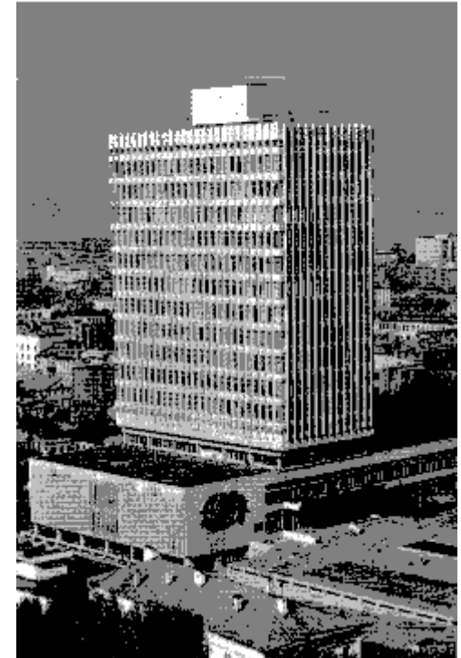
Физический факультет КГУ