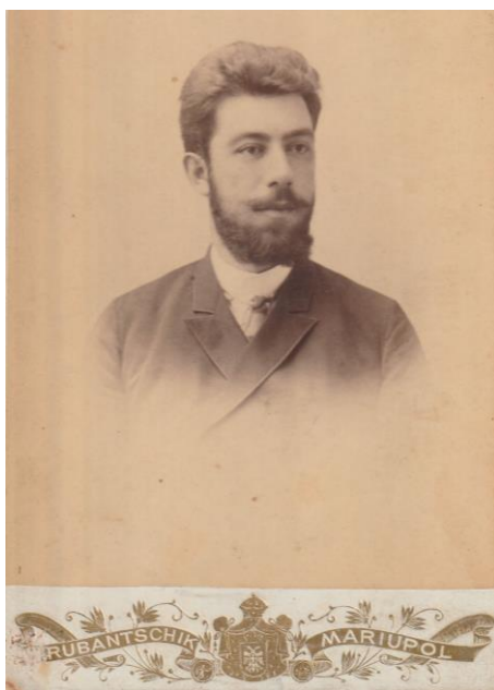
Фото 1. Портрет молодого Д.В. Айналова, примерно 1893–1895 гг. Публикуется впервые

Причем он скрывал эти факты еще задолго до советского времени. Чего он опасался, мы, наверное, никогда не узнаем.