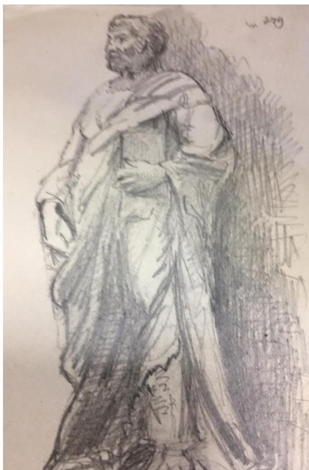
Рис. 1. Айналов Д.В. Рисунок памятника, карандаш. 1891–1892 гг. Копия с оригинала, хранящегося в Санкт-Петербургском филиале Архива РАН (XIX)