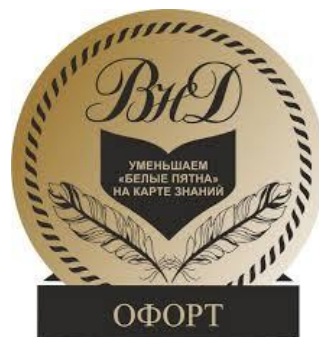
Издательство журнала «Вести научных достижений»