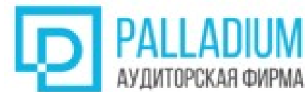
Аудиторская фирма «Палладиум»