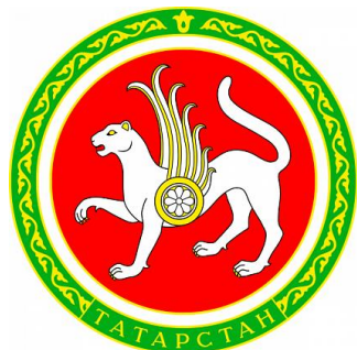
Министерство финансов РТ