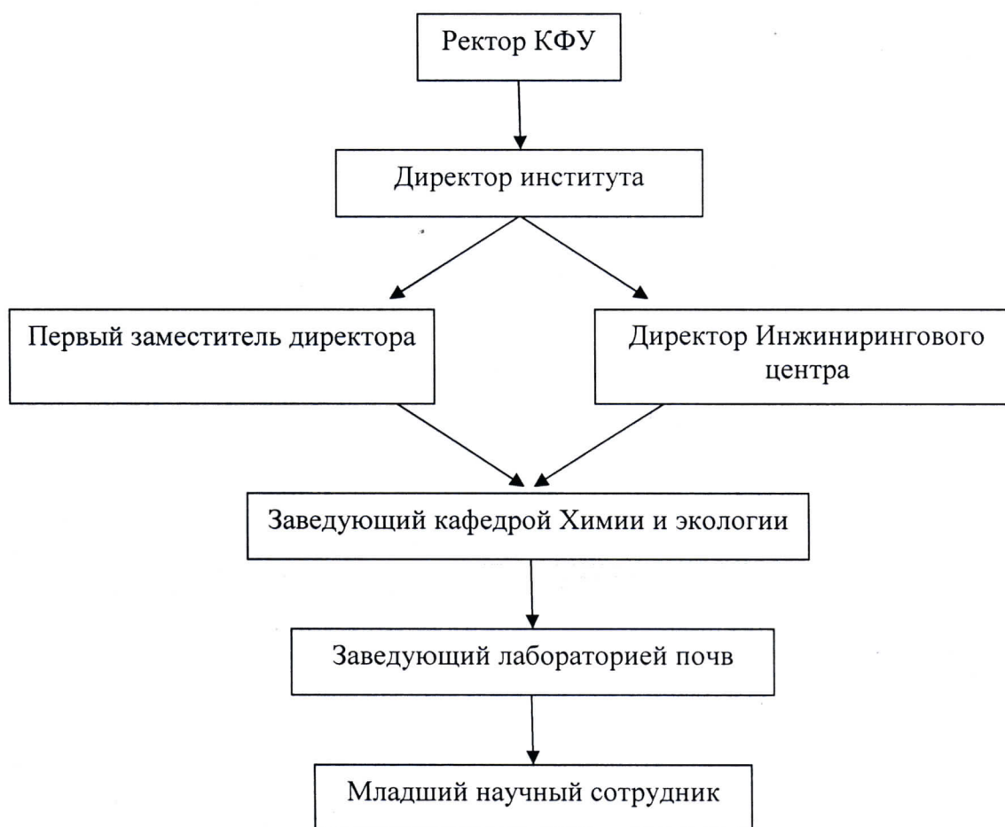
Схема административной подчиненности ЛП