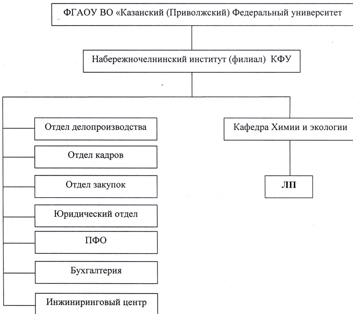
Схема взаимодействия со структурными подразделениями Института