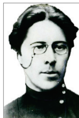
Фото 2. П.А. Сорокин