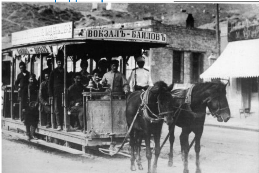
Предок трамвая - конка