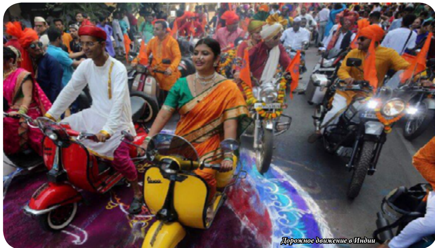
Дорожное движение в Индии