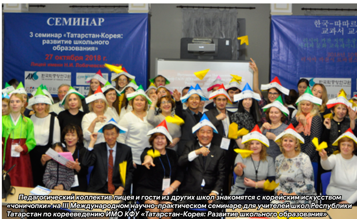
Педагогический коллектив лицея и гости из других школ знакомятся с корейским искусством «чоничопки» на III Международном научно-практическом семинаре для учителей школ Республики Татарстан по корееведению ИМО КФУ «Татарстан-Корея: Развитие школьного образования»

Тема номера: Диалог культур. Путешествия. Туризм