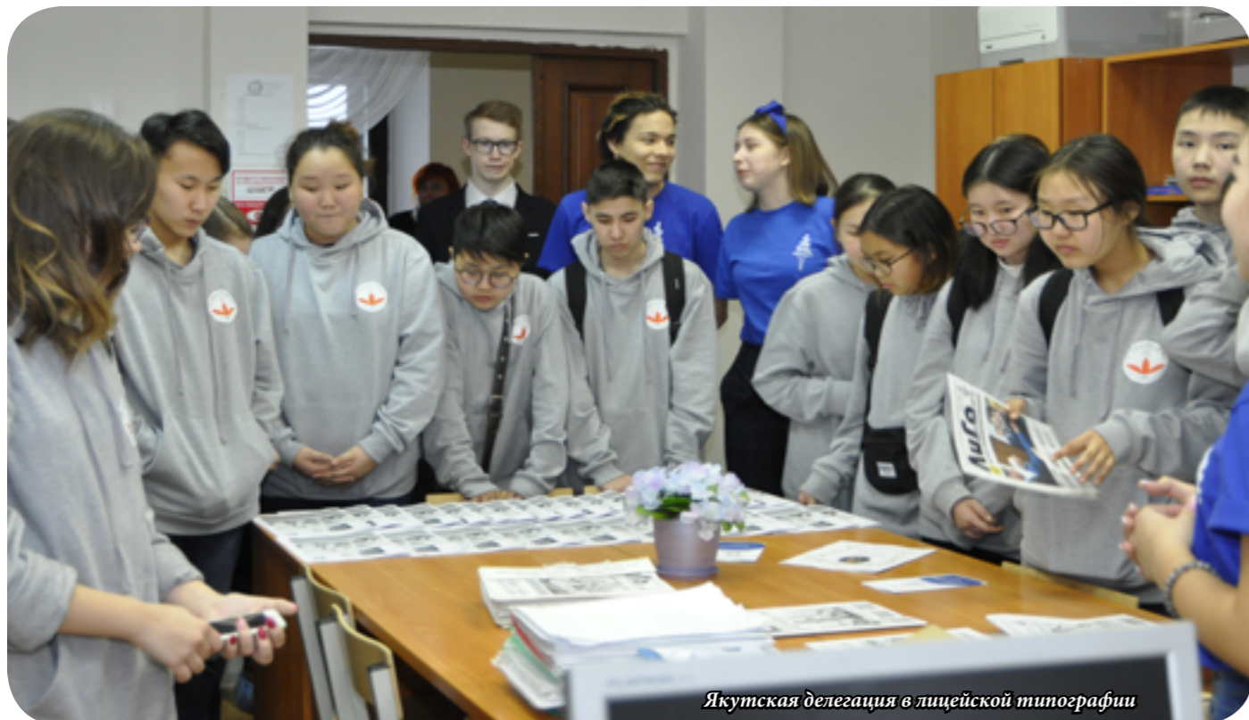
Якутская делегация в лицейской типографии

С 1 по 3 апреля лицей посетила делегация учеников и учителей из республики Якутия. За этот период они побывали на 18 открытых уроках. Каждое утро ребята встречались на традиционной лицейской зарядке, где учились татарским народным танцам. Участники также ознакомились с внеурочной деятельностью лицея по астрономии, русскому языку, математике и обучением новым профессиям. Особенно нашим гостям понравилась лицейская игра «Что? Где? Когда?», в которой они также приняли участие.