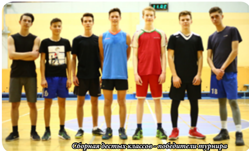
Сборная десятых классов - победители турнира

Последний матч был самый ожесточенный, так как он определял победителя. На первых минутах матча были травмированы три игрока команды 10-ых классов. Это подавило дух команды, но ко второму тайму она смогла оправиться. Счёт на этот момент был 7:8 в пользу команды 11-ых классов.