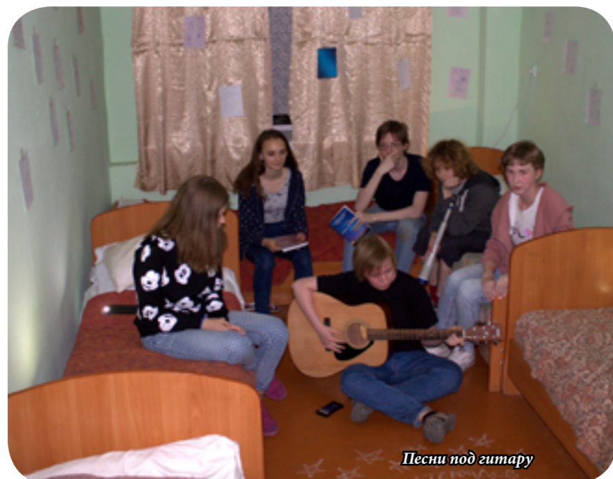
Песни под гитару

Самое время вспомнить еще про один лагерь - «Квант». Наш корреспондент пробыл там целую смену, которая длилась с 19 июня по 6 июля 2018 года. Эта ежегодная смена была уже сорок седьмой по счету и прошла не хуже прошлых смен.