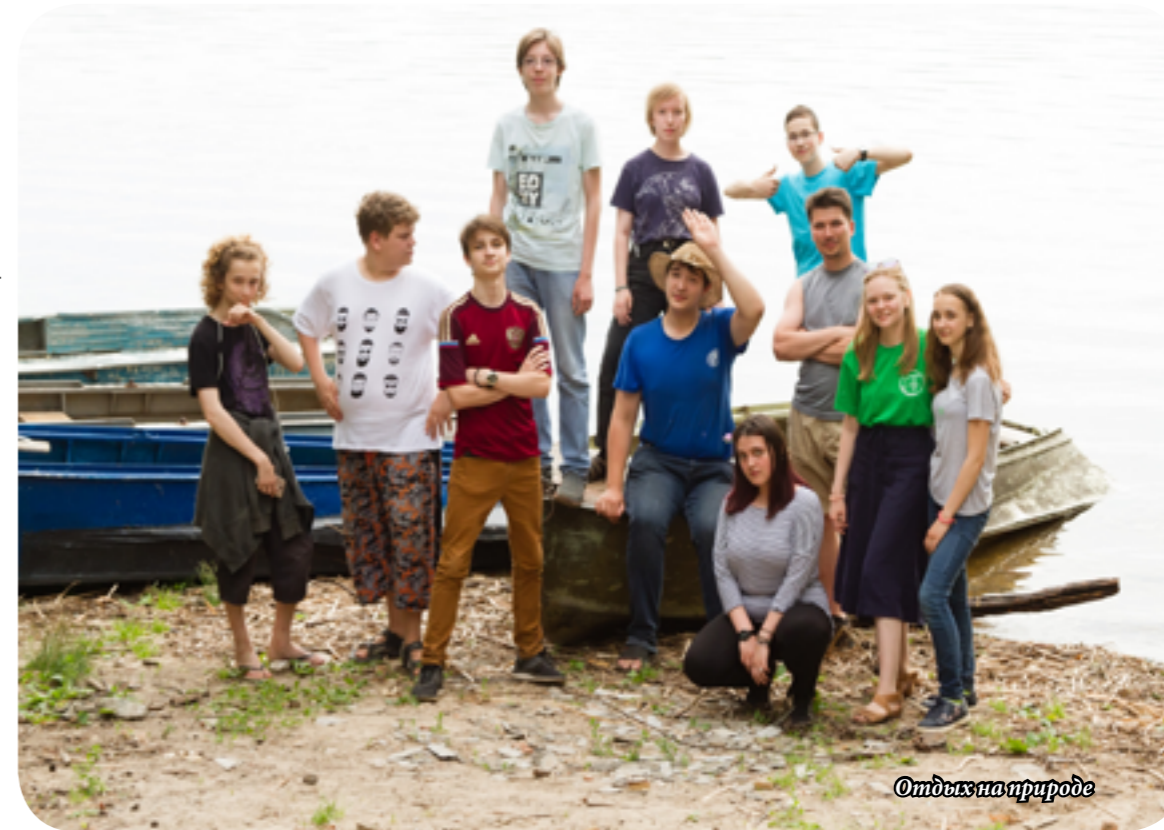
Отдых на природе

Данный репортаж имеет именно такой заголовок потому, что за время смены я приобрел огромный багаж знаний. Хочу, правда, заметить, что векторное умножение, сферическая геометрия и параллактические треугольники немного сложны для понимания семиклассника, каковым я являлся на тот момент, но со временем мой мозг обогащался, и материал стал даваться проще. В конце сме-