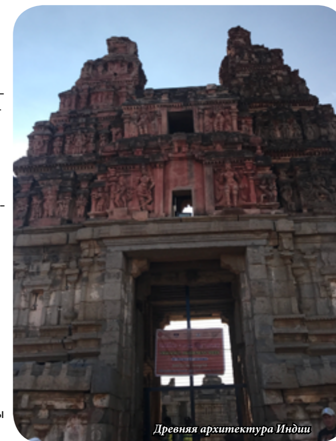
Древняя архитектура Индии

Местные сразу поймут, что вы турист, поэтому они все равно будут пытаться вас обмануть, и вы совсем этого не заметите, например, фрукты они взвешивают очень быстро, вы не успеете одуматься, как фрукты у вас в руках, а деньги у них. Но не переживайте: если они и обманывают, то на мелкую