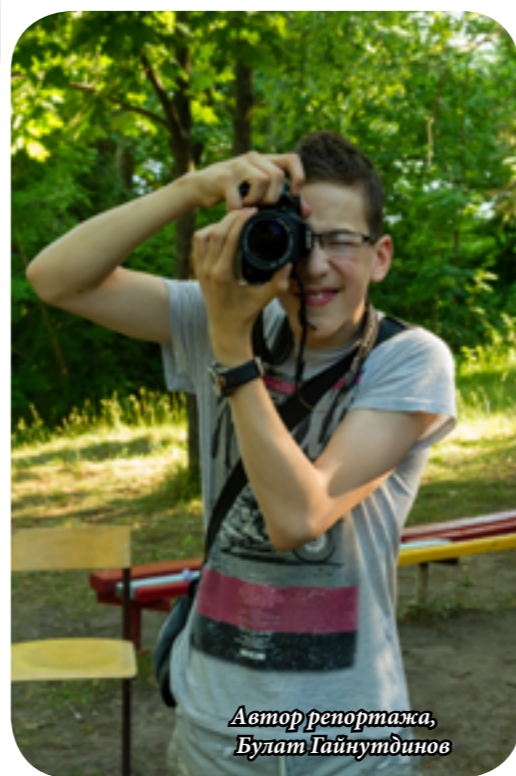
Автор репортажа, Булат Гайнутдинов

Кружков в «Кванте» довольно много, но мне запомнились следующие: кружок настольных игр, кружок фотографии и кружок рисования. Вечер все проводили по-разному: кто-то играл с жоа-