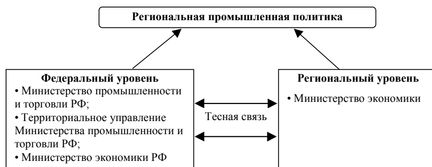
Рис. 1. Схема управления территориальной промышленной политикой региона

3. Внедрение современных методов энергосбережения и ресурсосбережения через государственный заказ и через систему программирования.