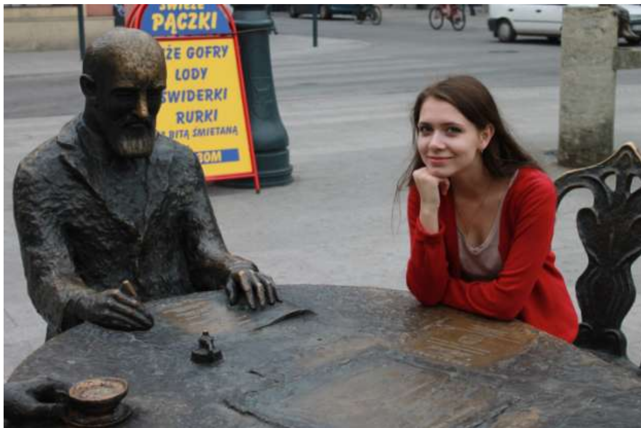
Памятник фабрикантам в Лодзи