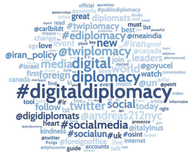
#DigitalDiplomacy Word Cloud