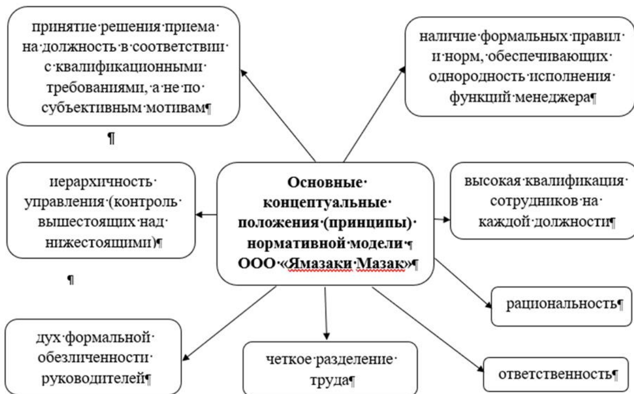
Рис. 2. Нормативная модель управления ООО «Ямазаки Мазак».

Анализ управленческой структуры связан с измерением внутренних координационных связей предприятия – от руководителя до исполнителя на самом близком к клиенту звене, что позволит дать достаточно полную организационно-экономическую характеристику компании ООО «Ямазаки Мазак». Наиболее интересным в плане организации внешнеэкономической деятельности предприятия является достаточно стройно налаженная логистическая работа, основанная на тесном взаимодействии всех структурных элементов.