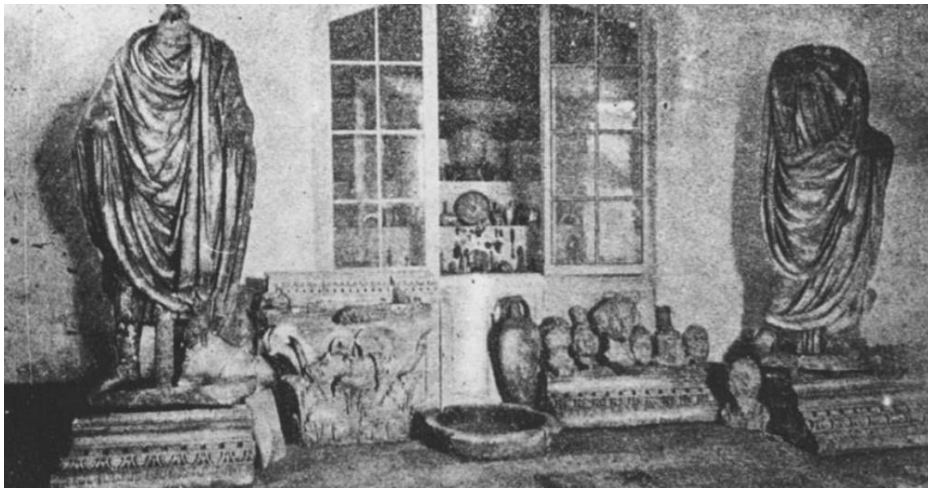
Рис. 1. Фрагмент экспозиции в ризнице церкви Санта Клара 1894 г. Código I.D. 0852

в том числе скульптуры «Митраистическая Венера», «Меркурий из Сьерро-де-Сан-Альбин», выставлялись на архитектурных элементах древнеримской архитектуры, например на базе или капители. Мозаика «Вакх и Ариадна» – первая экспонирующаяся в музее мозаика, закрепленная на стене без учета окружающего контекста.