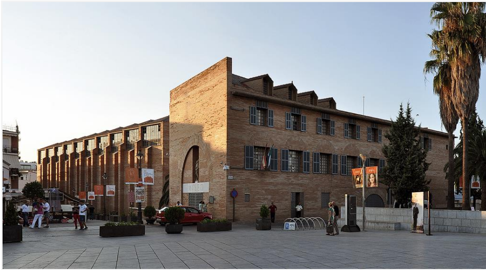
Рис. 5. Национальный музей римского искусства.

Все это позволяет определить Национальный музей римского искусства в г. Мериде как крупнейший субъект культуры, представляющий все аспекты повседневной жизни одного из главных городов на западной границе Римской империи – Августы Эмериты.