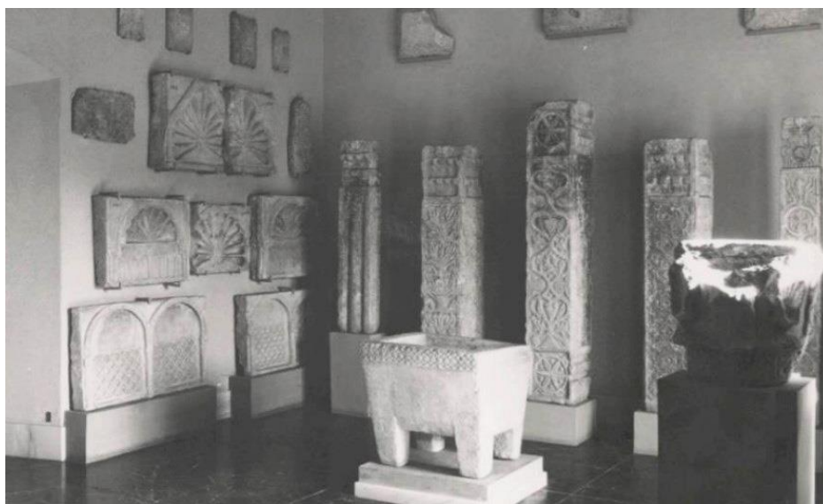
Рис. 3. Фрагмент экспозиции вестготской коллекции 1964 г. Фото: М. де ла Баррера Оканья. Источник: Архив Национального музея римского искусства M.N.A.R. Código 0546

основная информация о предмете, своего рода – этикетаж. Несколько значимых экспонатов имели нумерацию, которая расшифровывалась в путеводителе, выдававшемся посетителю. Впервые была организована стена, которая послужила своего рода фоном для экспонирования больших скульптур.