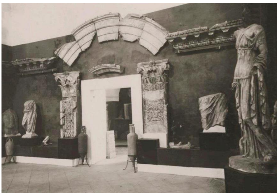
Рис. 2. Фрагмент экспозиции 1929–1930 гг. Источник: Архив Национального музея римского искусства M.N.A.R. Código I.D. 0253

Благодаря упорству двух археологов – Х.Р. Мелиды и М. Масиаса – и возрастающему значению древностей Мериды панорама экспозиции постепенно приобретала более четкие формы. С 1926 г. уже предпринимались серьезные действия по приданию окончательной конфигурации экспозиции музея в здании церкви Санта-Клара, которое в 1929 г. отдается исключительно под Археологический музей Мериды. В рамках организации новой музейной площадки одной из важнейших задач было аккумулятивное в едином пространстве археологических памятников, ранее разбросанных по всему городу: локализованных на месте целенаправленных раскопок и в местах случайного нахождения, а также находившихся в руках частных лиц.