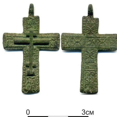
Рис. 3. Крест с территории Новгородской области (из частного собрания)

Близкими аналогиями можно назвать кресты-тельники из Илимского острога: по организации надписи на оборотной стороне схож с крестом типа 2, подтипа 2 [3, с. 49, рис. 52], по оформлению квадратов между зонами, заполненными надписями, – с крестом типа 4, подтипа 4, варианта 1, подварианта 2 [3, с. 58, рис. 76] и типа 4, подтипа 4, варианта 1, подварианта 1 [3, с. 213]. Все кресты датируются XVII – XIX вв. Кроме того, несколько псковских нательных крестов группы 2.1 с текстом тропаря «Кресту Твоему поклоняемся, Владыко, и святое воскресение Твое славим» датируются XV – XIX вв. [4, с. 125–126]. Схожий орнамент из завитков и штрихов между зонами, заполненными надписями, имеется также у литейной формы XVII – XVIII вв., описанной в статье В.М. Тетерятникова [5, с. 191, ил. 20–21].