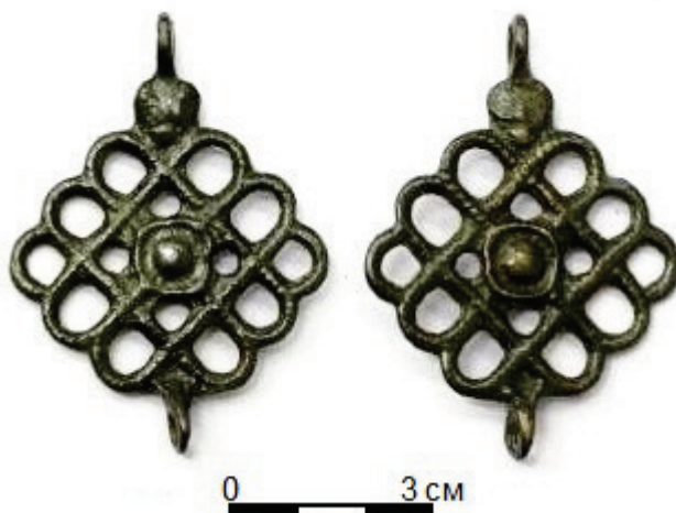
Рис. 4. Подвеска с Раскопа ХСV-1986 г. Болгара. Шифр: БГИАМЗ КП. 426-115/202

У подвески с Раскопа ХСV в центре имеется «глазок», который крепился позже, после отливки основной конструкции. Кроме того, мы видим, что верхнее и нижнее ушки после отливки поворачивались.