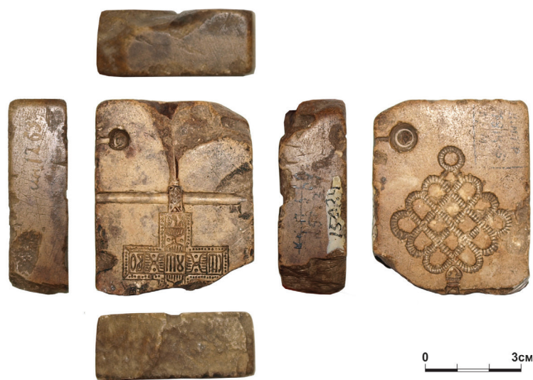
Рис. 1. Литейная форма из фонда археологии Национального музея РТ. Шифр: НМРТ 7814-5, Инв. 15024

для ажурных подвесок 3 . Вероятнее всего, оба литейных гнезда – и для крестательника, и для подвески – были выполнены одновременно.