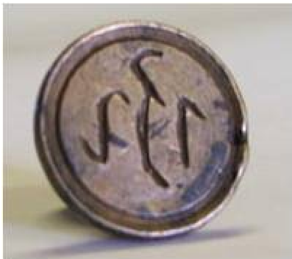
Рис. 1. Медная печать с руническими знаками

найденную в Усть-Алданском улусе при раскопке кулун-атахской культуры, а также комбинированные надписи XVII -XVIII вв., в которых, по нашему мнению, в немалом количестве имеются рунические знаки. По всей вероятности, некоторая часть якутов до позднего времени сохранила письменность предков и пользовалась ею. В частности, о существовании таинственной письменности у предков якутов упоминается не только в олонхо и преданиях, но и встречается в рассказах старожителей. Очень часто сказывается, что таинственными знаками пользовались шаманы и народные лекари, сказители народного эпоса олонхо.