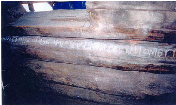
Рис. 3. Надпись из Хотугу Челгерия