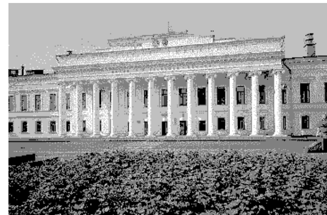
Главное здание Казанского университета

14.45 Отправление автобуса на железнодорожный вокзал