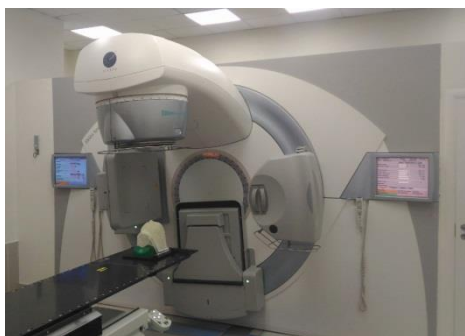
Линейный ускоритель электронов Synergy S

ЯМР спектрометр Bruker Avance III HD 700 (700 МГц по ядрам ^1\text{H} ) с криодатчиком