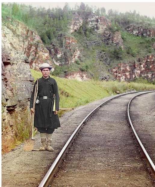
Фото 7. С.М. Прокудин-Горский. Стрелочник-башкир у станции Усть-Катава летом. 1910 г. (Прок.-Горск.)