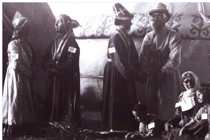
Фото 1. Фотолитография Московской фирмы «Шерерь, Набоглыц и КО», 1867 г. Экспонаты Российского этнографического музея (Гр. Башкир)