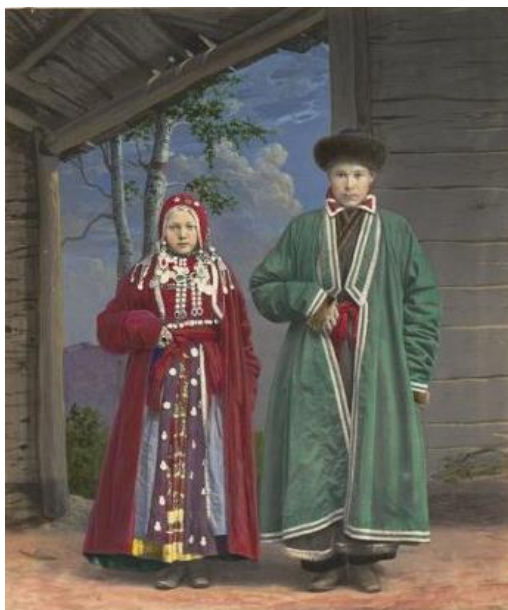
Фото 3. М. Букаръ. Башкиры-скотоводы. 1872 г. (Башк.-ск.)