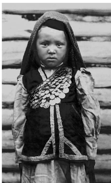
Фото 5. Девочка-башкирка. БАССР, Арга-яшский кантон, д. Асфаган. 1930 г.