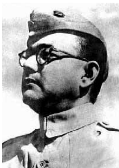
Субхас Чандра Бос: борец за независимость Индии, фашистский коллаборационист.

Почитаем в настоящее время наравне с Дж. Неру и М. Ганди. Для борьбы с английскими колонизаторами пошёл на сотрудничество с немцами, а затем с японцами, возглавив так называемый Индийский легион в составе вермахта (затем – войск СС).