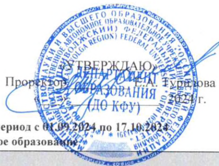
График проведения консультаций на период с 01.09.2024 по 17.10.2024 44.04.01 Педагогическое образование