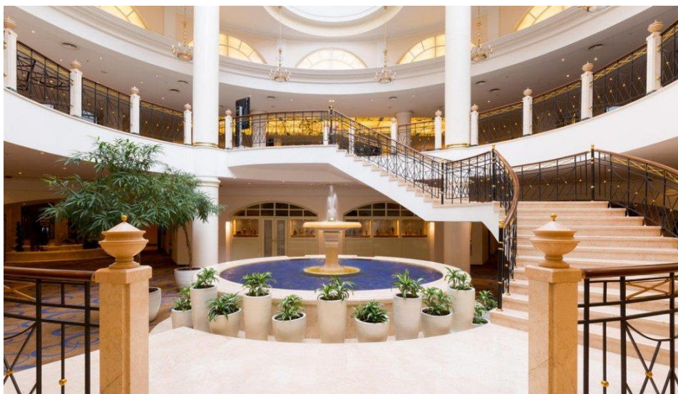
Рисунок – Marriott Grand Hotel