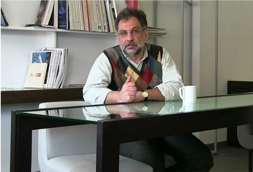
Георгий Дерлугьян

Есть два способа вымирания: позорный и почетный. Позорный способ: мы измельчаем до того, что создадим факультет изучения мексиканских женщин-эмигрантов, и тогда нас прикроют при следующем сокращении бюджета (а сокращение будет обязательно). Вас похоронят не ваши интеллектуальные дебаты, вас похоронит сокращение кадров, потому что вы не сможете выстоять в одиночку.