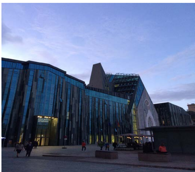
Холл в университете