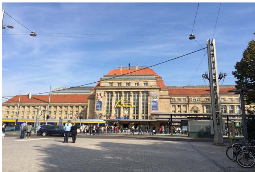
Главный вокзал Лейпцига

До Лейпцига я прилетела на самолете. Мне повезло с ценой билета: я прилетела в сам Лейпциг, а не в соседний город. От аэропорта я доехала на поезде до главного вокзала за 2,60 евро и жила один день у хоста, который предоставил мне бесплатную комнату по сайту www.couchsiring.com . На следующий день я поехала в университет на трамвае. Одноразовый билет на любой внутригородской транспорт в Лейпциге стоит 2,60 евро. В университете я зачислилась как студент по обмену, получила студ. Карту и сумку с символом университета с подарками внутри. ☺ Вся процедура прошла без сбоев, хотя было много иностранных студентов. Поэтому, приходите ранним утром, чтобы встать в очередь и пройти все «станции» одним из первых.