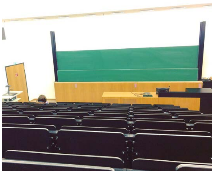
Одна из аудиторий в университете.