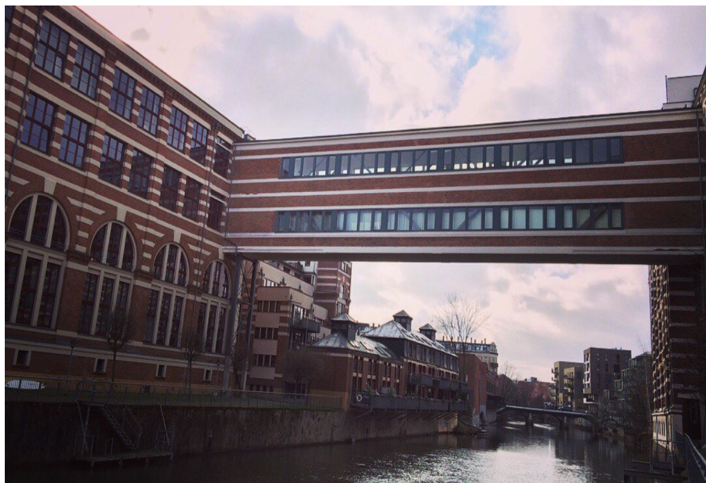
Коммерческий банк Лейпцига