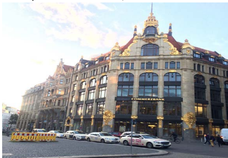
В центре Лейпцига