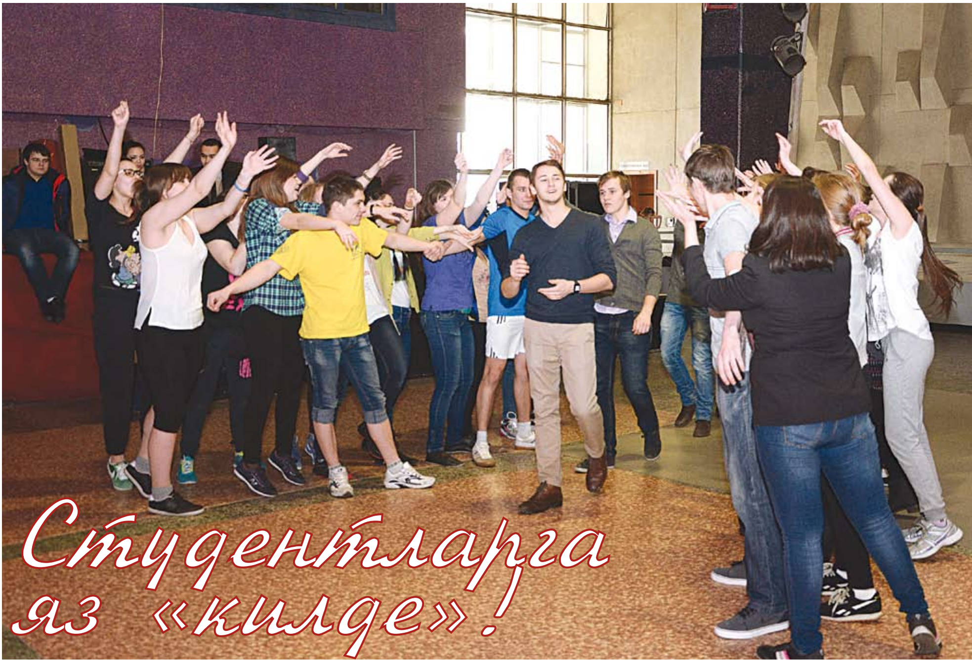
♦ Фотота: студентлар фестивалгә эзерлек барышында.