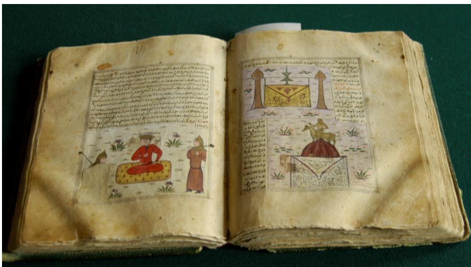
Приложение 6. Персидская рукопись XV в. из собрания И.Ф. Готвальда