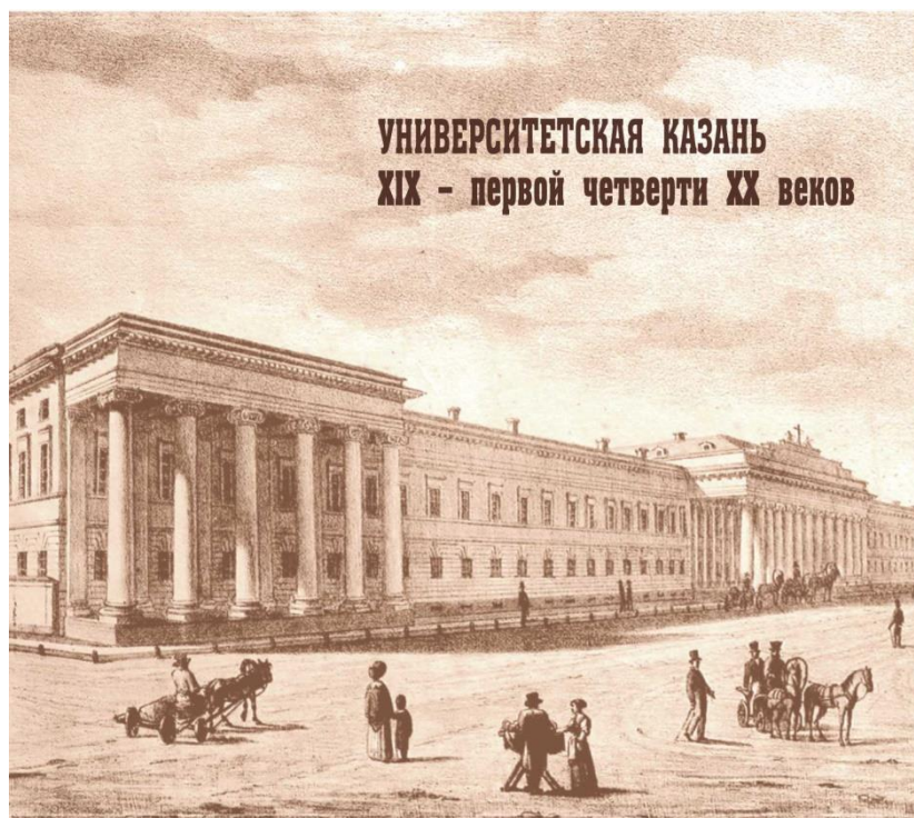
Приложение 13. Альбом «Университетская Казань (XIX – первой четверти XX вв.)»