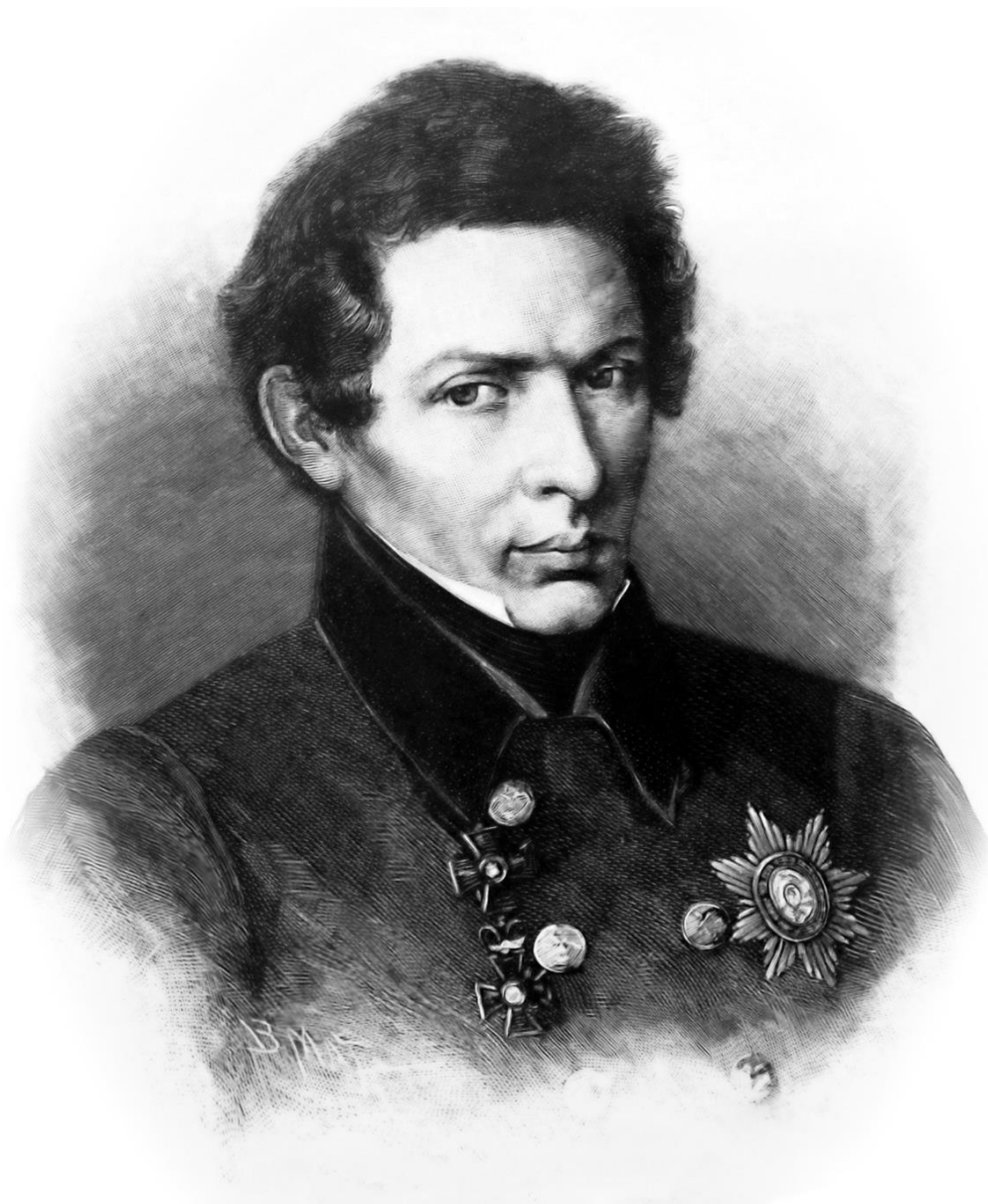
Приложение 4. Николай Иванович Лобачевский (1792-1856 гг.)