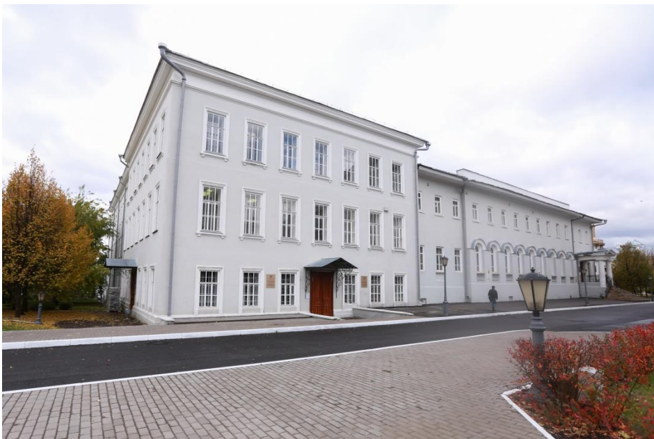
Приложение 3. Историческое здание Научной библиотеки им. Н. И. Лобачевского Казанского (Приволжского) федерального университета