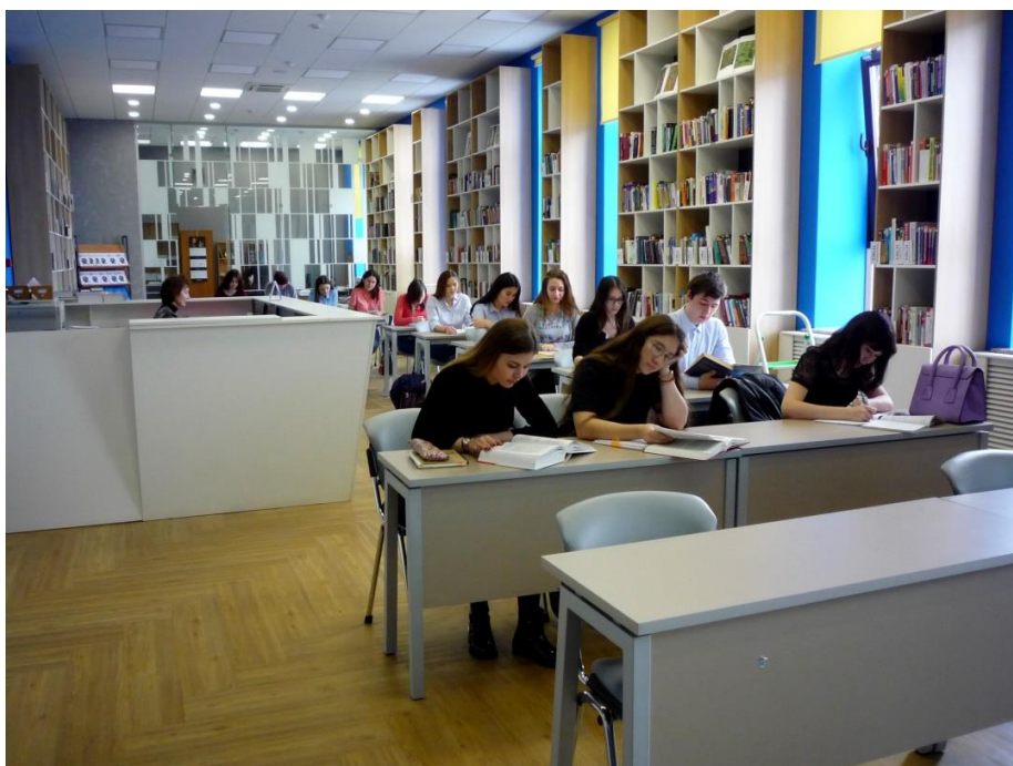
Приложение 8. Читальный зал отдела информационно-библиотечного обслуживания экономического профиля Научной библиотеки им. Н. И. Лобачевского Казанского (Приволжского) федерального университета