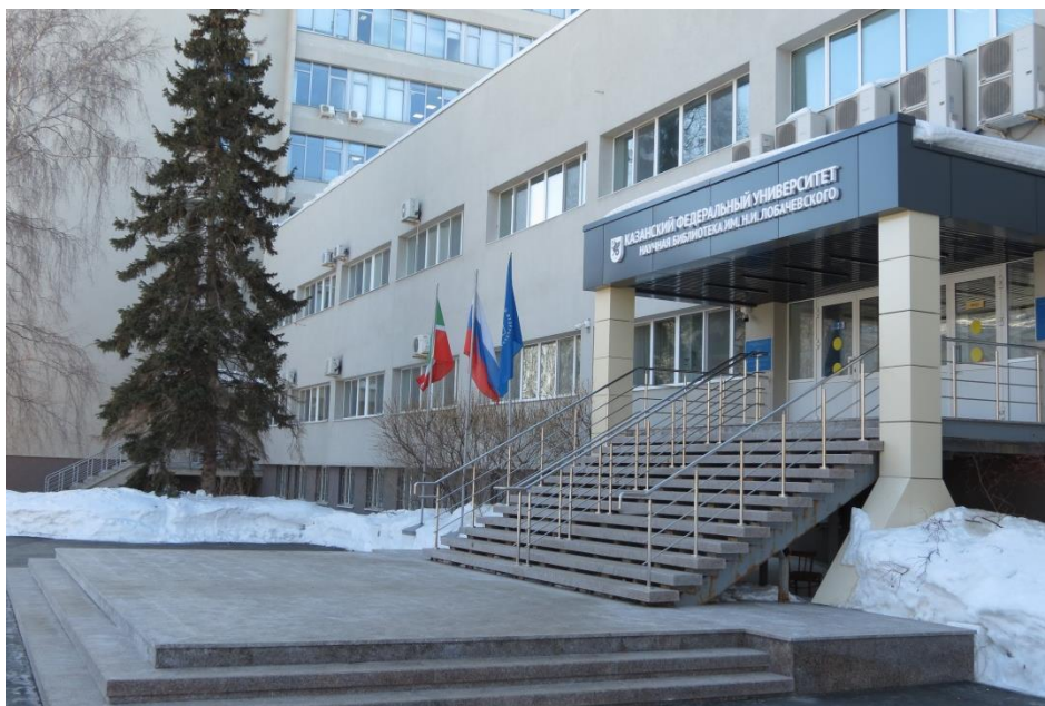
Приложение 2. Основное здание Научной библиотеки им. Н. И. Лобачевского Казанского (Приволжского) федерального университета