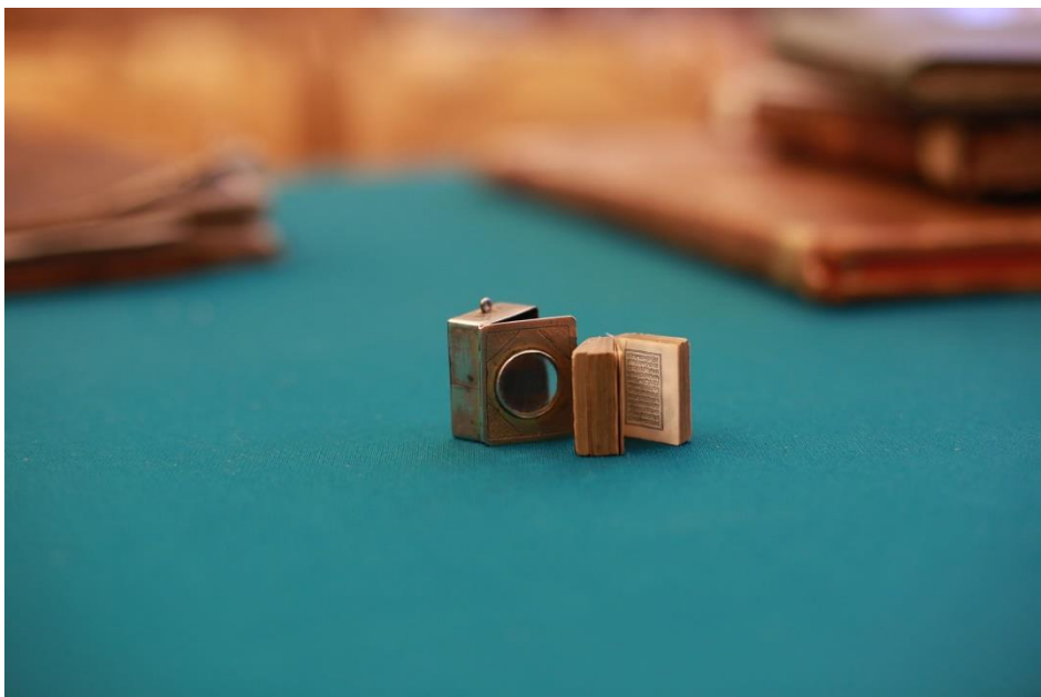
Приложение 14. Миниатюрное издание Корана