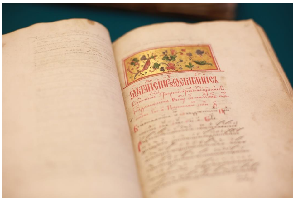
Приложение 15. Октоих. Рукопись XVII в.