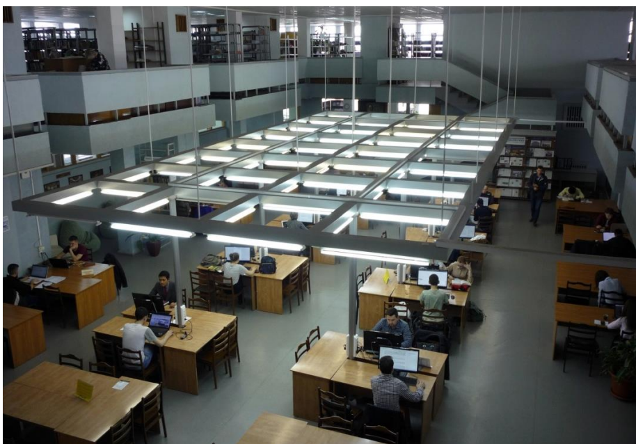
Приложение 9. Читальный зал №2 Научной библиотеки им. Н. И. Лобачевского Казанского (Приволжского) федерального университета