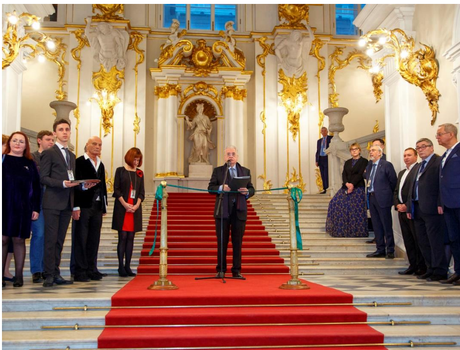
Приложение 12. Открытие выставки Государственного Эрмитажа «Это сам Потемкин! - К 280-летию светлейшего князя Г. А. Потемкина-Таврического» (декабрь 2019 – март 2020 гг.)