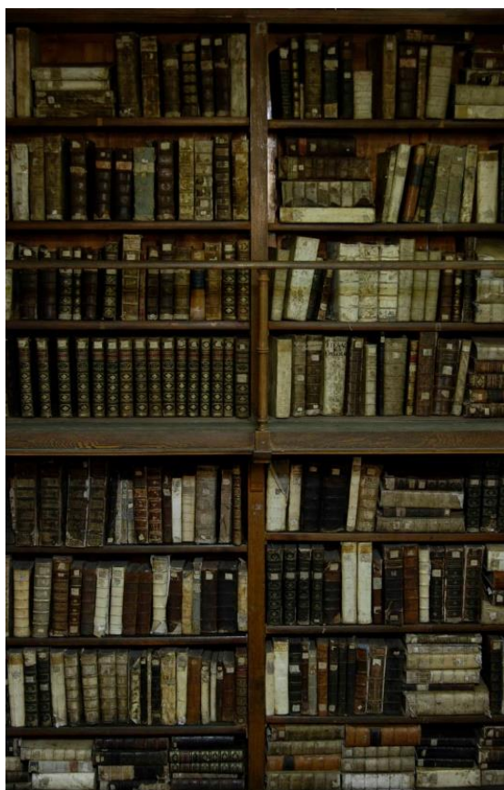
Приложение 7. Старопечатные издания в читальном зале отдела рукописей и редких книг