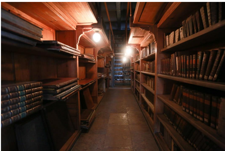
Приложение 16. Интерьер исторического здания Научной библиотеки им. Н. И. Лобачевского Казанского (Приволжского) федерального университета