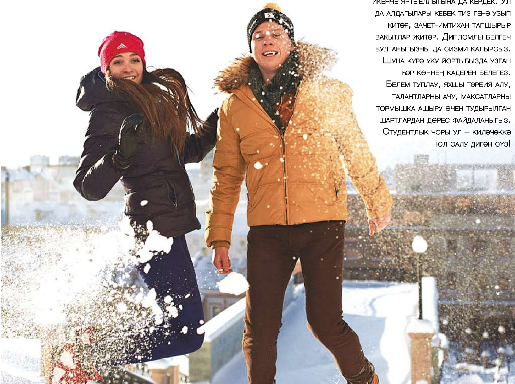
«Лица КФУ» проекты фотосы

Белем иленә яна сөяхәт башланды, дусларыбыз. 2013/2014 уку елының икенче яртыеллыгына да кердек. Ул да алдагылары кебек тиз генә узып китәр, зачет-имтихан тапшырыр вакытлар житәр. Дипломлы белгеч булганыгызны да сизми калырсыз. Шуна күрә уку йортыбызда узган һәр көннең кадерен белегез. Белем туплау, яхшы төрбия алу, талантларны ачу, максатларны тормышка ашыру өчен тудырылган шартлардан дәрәс файдаланыгыз. Студентлык чоры ул – килчәккә юл салу дигән сүз!