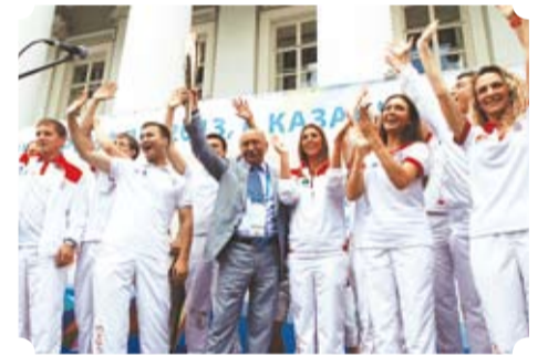
FISU житекчесе Клод Луигальен, Татарстан Президенты Р.Миңнеханов һәм башка рәсми кунаклар катнашты.

14 июль көнне Универсиада авылының Халыкара мәгълүмәтиүзәгендә FISUның «Университет һәм олимпия спорты: ике модель – бер максат?» дип аталган конференция ачылды. Тантаналы чарада