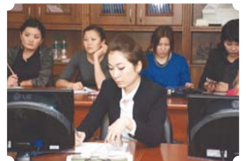
ма вәкилләреннән торган делегация белән очрашу узды. Аларны уку йортыбызның актив студентлары һәм Казахстаннан килеп укучы студентлар каршы алды.

КФУда «Яңа буын» программасы кысаларында Казахстан һәм Кыргызстаннан килгән яшь галимнәр һәм төрле фәнни оеш-