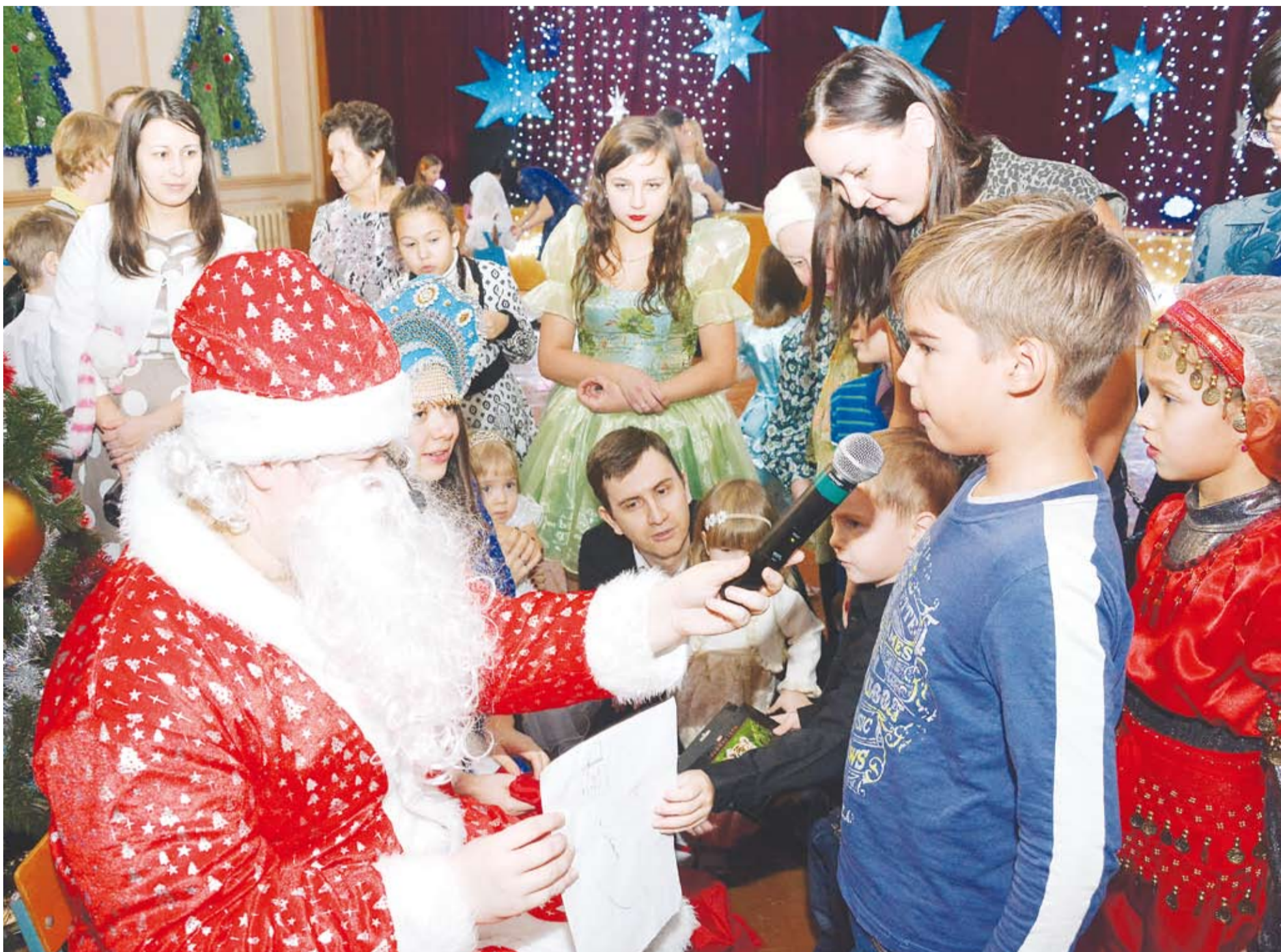
■ Рәсемдә: Уку йорты хезмәткәрләренең балалары өчен оештырылган Яңа ел бәйрәмнәреннән күренешләр.