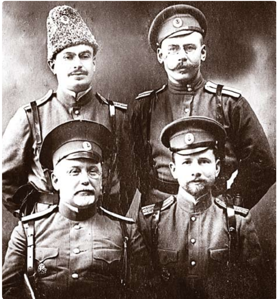
▲ Фотография 1915 года. Прадед – сверху слева.