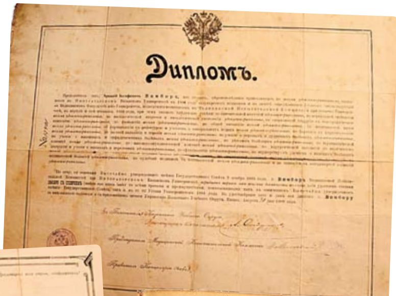
Диплом А.И.Вимбор, выданный в 1908 году ▶