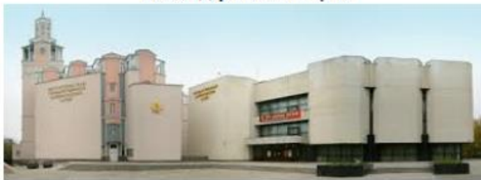
Поход в Дарвиновский музей