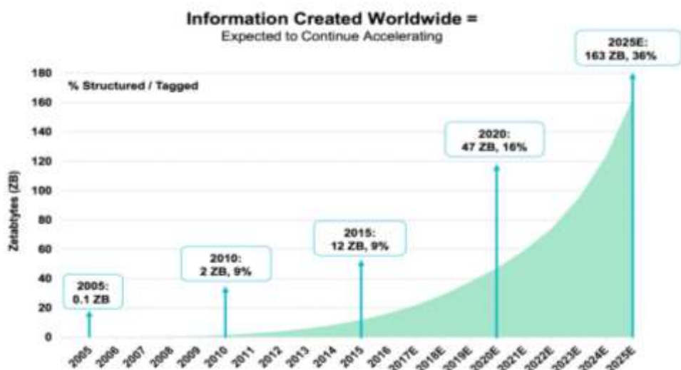
Рис. 1. Темпы роста создаваемой в мире информации в зеттабайтах (1 петабайт= 1 млн гигабайт, 1 зеттабайт = 1 млн петабайт)

In-Memory Computing, или вычисления в оперативной памяти — это технология, позволяющая в режиме реального времени обрабатывать огромные массивы данных. Она представляет собой хранение информации в основной оперативной памяти (ОЗУ) выделенных серверов, а не в сложных реляционных базах данных, которые работают на сравнительно медленных дисках. Сегодня, когда почти любому современному бизнесу приходится иметь дело с Big Data, решения на основе in-memory computing внедряются практически во всех отраслях (рис. 1).