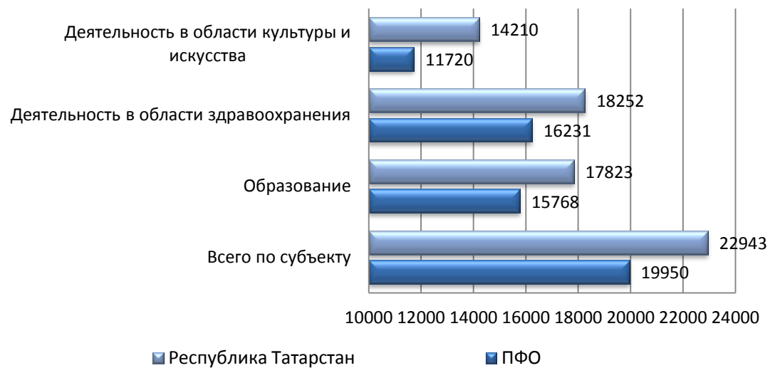
Динамика среднемесячной номинальной заработной платы работающих в экономике и бюджетной сфере Республики Татарстан