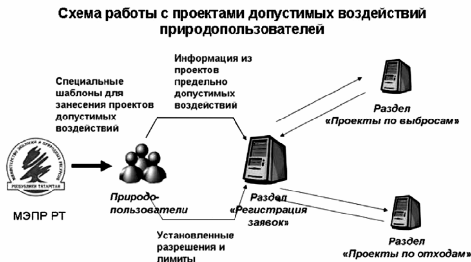
Рис. 2.1.3. Схема работы с проектами допустимых воздействий (Государственный доклад..., 2008)