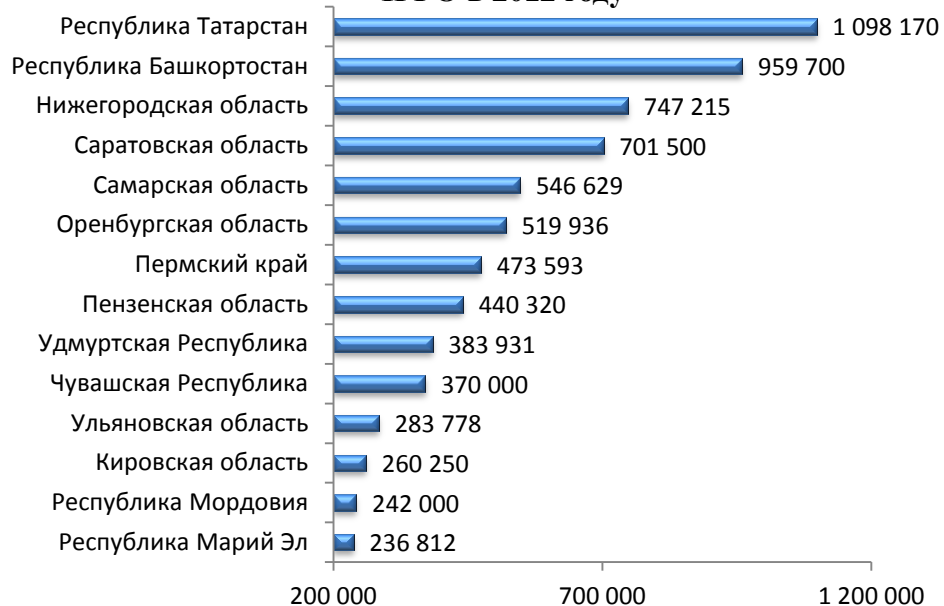
Прогнозные целевые значения показателей в РТ