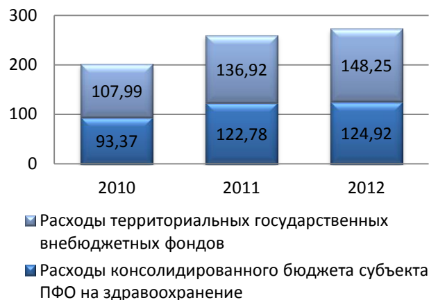
Расходы ПФО на здравоохранение (млн. рублей)