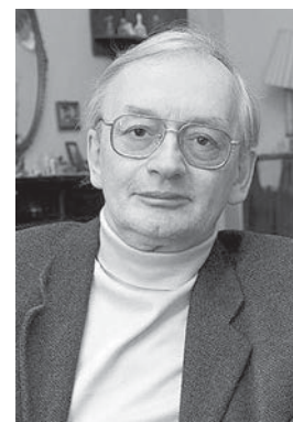
Алексей Александрович Старобинский

Алексей Старобинский вместе с А. Гуттом и А.Д. Линде является основоположником теории ранней Вселенной с де-ситтеровской (инфляционной) стадией. Наиболее важные результаты в этой области: первый расчет спектра гравитационных волн, генерируемых на инфляционной стадии, первая последовательная модель инфляционного сценария, первый (одновременно, но независимо от С.Хокинга и А.Гута) количественно правильный расчет спектра возмущений плотности, теория стохастической инфляции, теория разогрева материи во Вселенной после конца инфляционной стадии, теория перехода от квантового описания первичных неоднородностей к классическому.