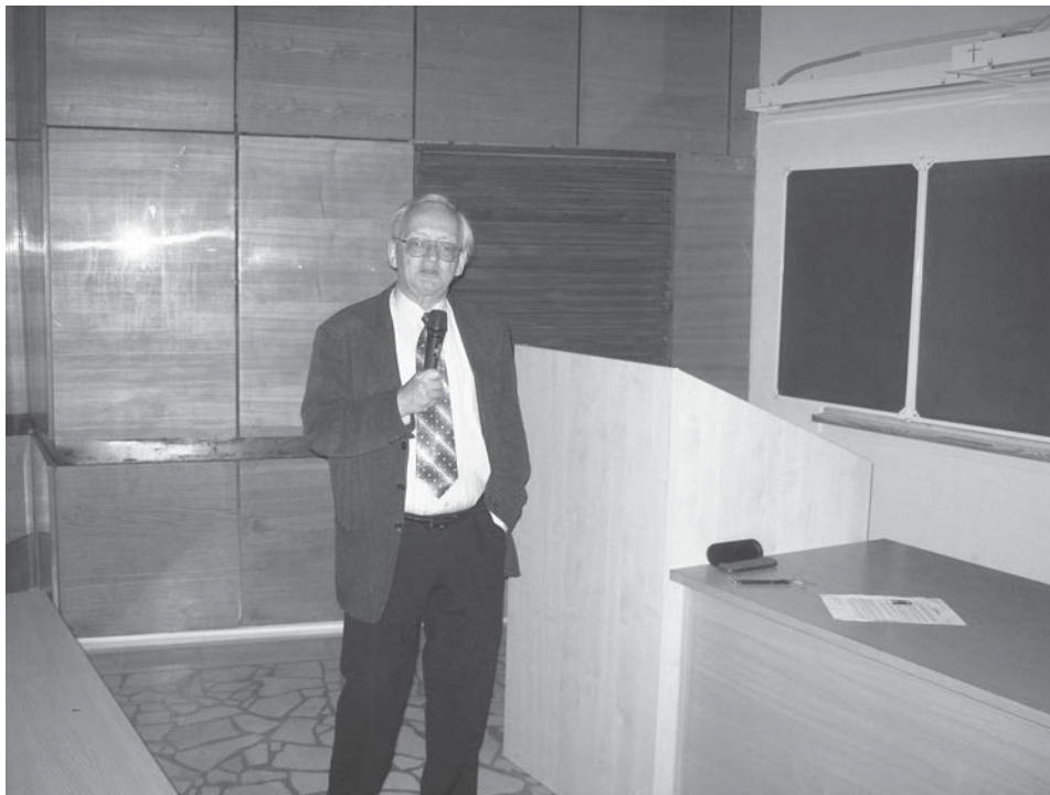
Лекция академика Старобинского

Надо сказать, что все пять лекций прошли при полном аншлаге большой лекционной аудитории. Было много вопросов и оживленных дискуссий.