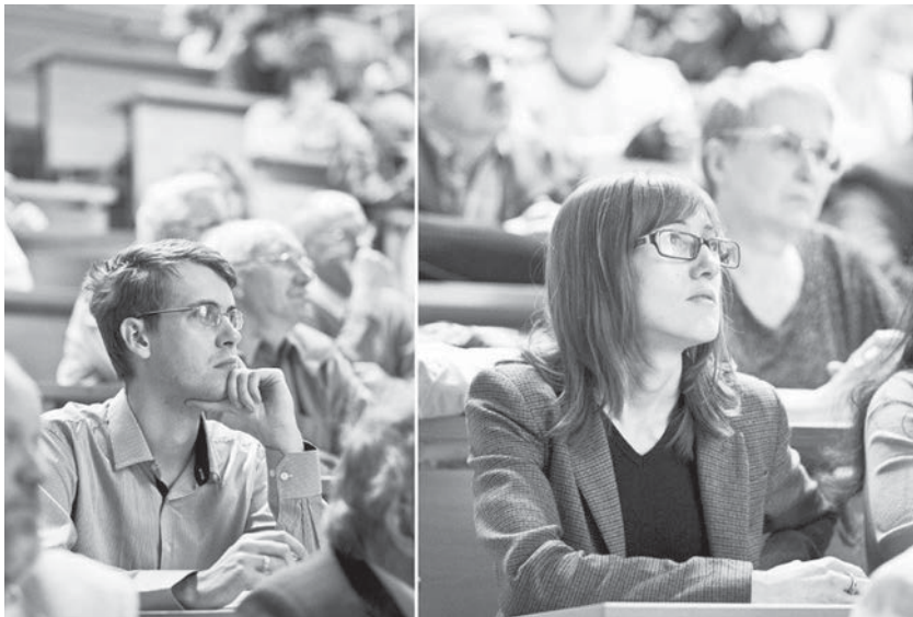
Молодые слушатели лекций