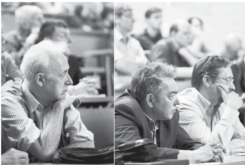
Не очень молодые слушатели лекций