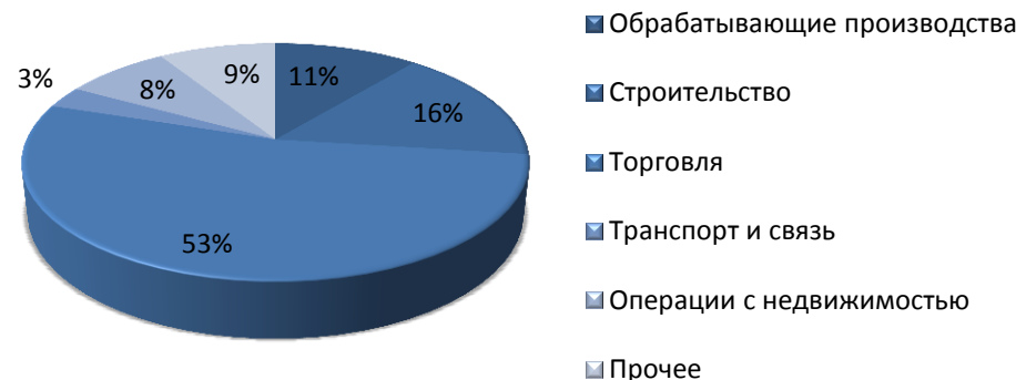
Структура оборота малых предприятий (без микропредприятий) в 2012 году в Республике Татарстан

Согласно прогнозу, составленному Министерством регионального развития РФ, к 2014 году доля населения, занятого в сфере малого и среднего бизнеса, относительно общей численности занятого населения составит более 30%.