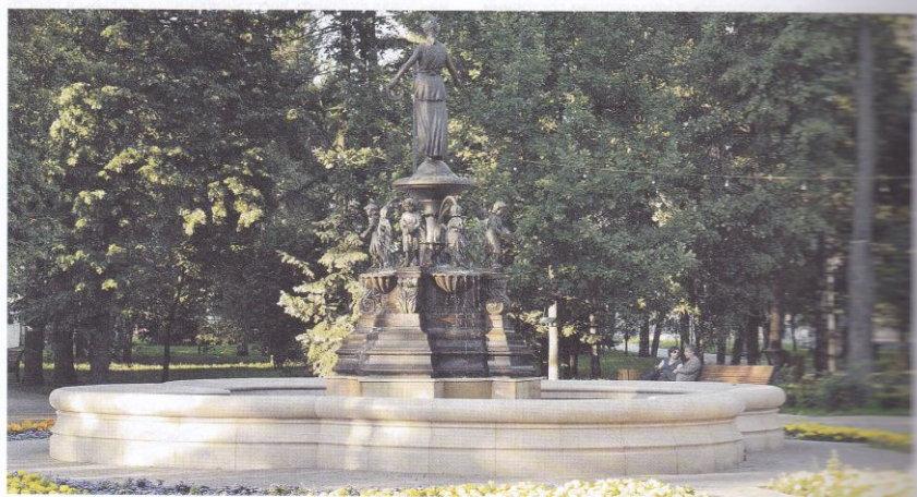
Современный вид фонтана

ГОРОДСКИЕ САДЫ В КАЗАНИ ПОЯВИЛИСЬ ПОСЛЕ УТВЕРЖДЕНИЯ ПЕРВОГО РЕГУЛЯРНОГО ПЛАНА ГОРОДА В 1768 ГОДУ, ТО ЕСТЬ ИСТОРИИ ВОЗНИКНОВЕНИЯ ОТКРЫТЫХ ОЗЕЛЕНЁННЫХ ОБЩЕСТВЕННЫХ ПРОСТРАНСТВ ЗДЕСЬ НАСЧИТЫВАЕТ ОКОЛО ДВУХСОТ ПЯТИДЕСЯТИ ЛЕТ.