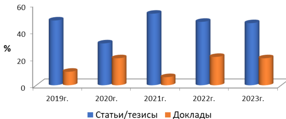
Рис. 2. Динамика участия студентов, будущих педагогов, в научных конференциях

Среди студентов педагогической магистратуры (120 человек) проведена диагностика парциальной готовности к профессионально-педагогическому саморазвитию [4]. Было установлено, что студенты, участвующие в научных конференциях, имеют более высокую готовность к профессиональному саморазвитию. Это относится к таким компонентам готовности, как нравственно-волевой (умение доводить начатое до конца, трудоспособность) и коммуникативный (способность организовывать самообразовательную деятельность) ( p \geq 0,95 ) (рис. 3). Личностно-значимые профессиональные ориентиры, определяющие направленность магистрантов на включение в научно-исследовательскую деятельность, расширяют границы педагогической компетентности и указывают на постоянное творческое саморазвитие личности будущего педагога.