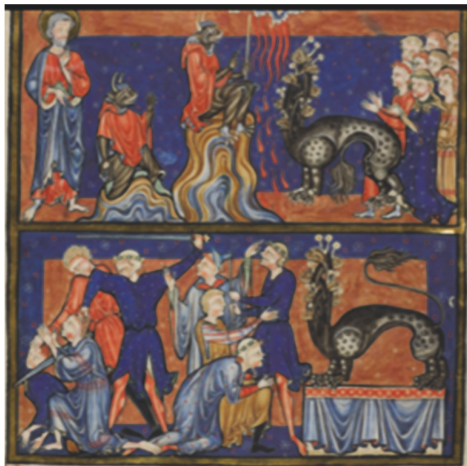
Рис. 11. Троицкий Апокалипсис, XIII век

заметить, как мастер запечатлевает и момент совершения договора между Антихристом и высшими силами, и момент его расторжения. Как и подобает царственной особе, Антихриста сопровождает бес-советник и даже бес-писарь (рис. 13–14).