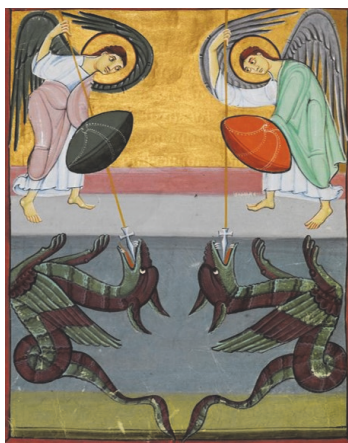
Рис. 8. Зеркальное изображение схватки Ангела и крылатого дракона