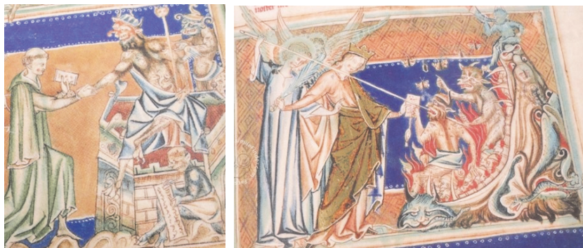
Рис. 13 и 14. Апокалипсис леди де Куинси в Лондоне. Ламбетский дворец

Кроме того, значительно расширился круг пользователей и читателей подобного рода произведений, в него вошли и низшее дворянство и низшее духовенство, а, следовательно, увеличилось и количество книг - число сохранившихся иллюстрированных апокалипсисов удвоилось по сравнению с XIII веком. [2, р. 33]