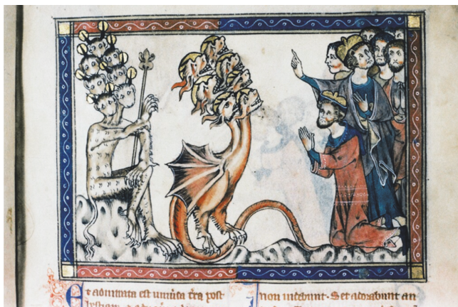
Рис. 12. Англо-нормандский Апокалипсис Гульбенкянского музея