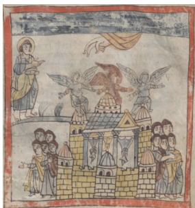
Рис. 5. Трирский Апокалипсис. IX век. Эйдолоны, населяющие грешный город Вавилон