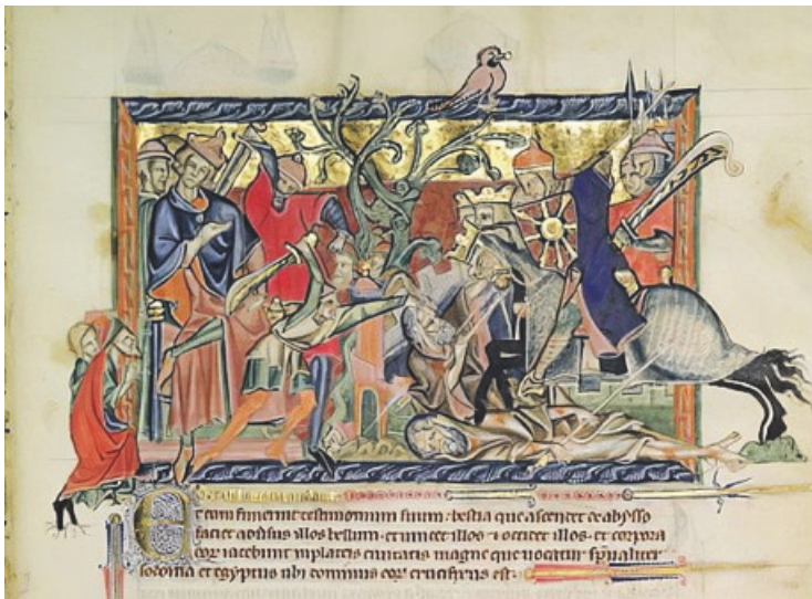
Рис. 15. Англо-норманский Апокалипсис Гульбенкянского музея в Лиссабоне. Fol. 26