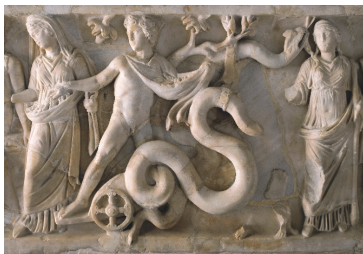
Рис. 1 и 2. Трирский Апокалипсис. IX век. Закованный Сатана, крылатый дракон и вооруженное франкское войско. Саркофаг богини Деметры, запряженный крылатыми змеями