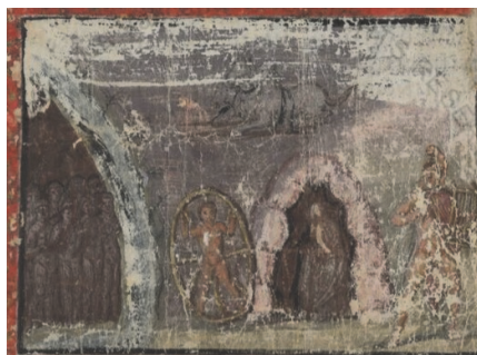
Рис. 4. Позднеантичный кодекс Vergilius Vaticanus. Эйдолоны, свергнутые в пещеру Аида с тенями мертвых