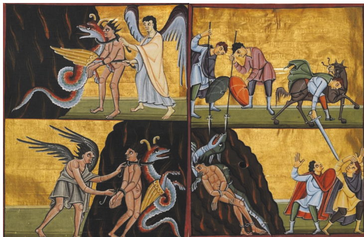
Рис. 6 и 7. Бамбергский Апокалипсис (ок 1000) Связывание и освобождение Дьявола

Таким образом, в Бамбергском апокалипсисе изменения в репрезентации фигур Зла были продиктованы, скорее, организацией самого изображения, принципами симметрии и упрощения, а не возросшими в обществе эсхатологическими ожиданиями.