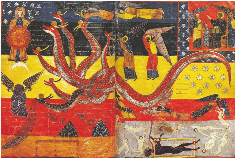
Рис. 9 и 10. Беатус Фукундус. Крылатый змей и закованный в клетке Дьявол

Несмотря на специфический стиль испанских рукописей, с их яркой контрастной колористикой, трактовка фигур, олицетворяющих Зло, здесь вполне, если можно так выразиться, классическая. На страницах манускриптов мы можем увидеть главных героев Апокалипсиса – крылатого змея и апокалиптического зверя. При этом тема наказания человечества за грехи практически отсутствует. Интересно и то, как показан закованный в конце времен Дьявол – здесь он не просто связан цепями, как это обычно демонстрирует северная традиция, а заперт в клетке.