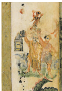
Рис. 3. Евангелие Рабулы, VI век. Исцеление бесноватого