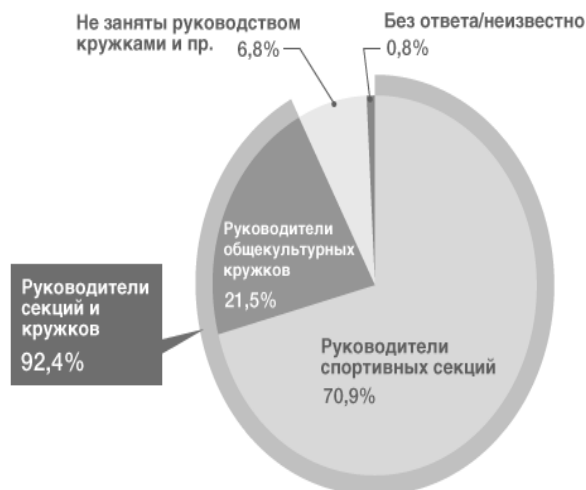
Рис.2 Доля преподавателей, руководящих кружками и секциями, в школах средней ступени