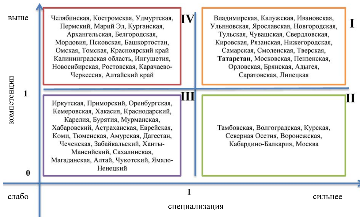
Рис. 1. Группировка регионов по уровню «специализации/компетенций» (составлено автором)