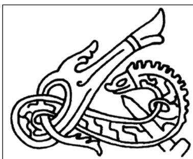
Рис. 3. Меч, самопроизвольно поражающий дракона. Орнамент с декоративного топорика из Владимиро-Суздальской области [20, р. 263, fig. 16]

Таким образом, помимо свидетельств источников, есть еще и свидетельства изобразительные, на которых представлены мечи, действующие без помощи че-