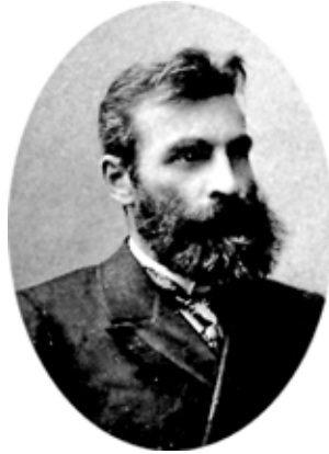
Фото 1. Владимир Иванович Савва

работы «малого жанра» – статьи, рецензии, заметки по различным вопросам внутреннего развития и внешнеполитических сношений Руси, а также стратегий ее восприятия иноземными путешественниками XVI – XVII вв. (Врем.мест. крещ.; Т.Смит.пут.; Пут.антиох.патр.1; Обр.омов.; Неск.случ.). Отдельно стоит сказать и о публикационных заслугах ученого: подготовленные В.И. Саввой в ходе длительных разысканий в архивохранилищах подборки редких документов XVII – XIX вв. и по сей день представляют большую ценность (Арзам.бармин.; Соч.прот.еп.; Дневн.мас.; Кузьмищ.кор.).