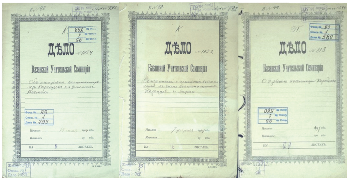
Рис. 1. Титульные листы дел 580, 792 и 793

Желательно, чтобы молодые люди, которые придут для поступления в семинарию, отлично знали корейский язык, так чтобы с ними мож-