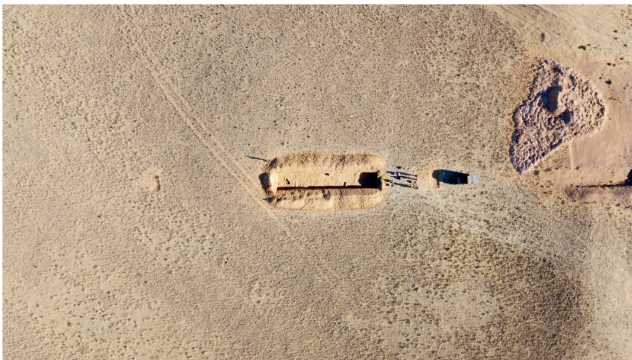
Рис. 7. Археологические исследования мавзолеев эпохи Узбек-хана у с. Лапас, Астраханская обл., сентябрь 2024 г.