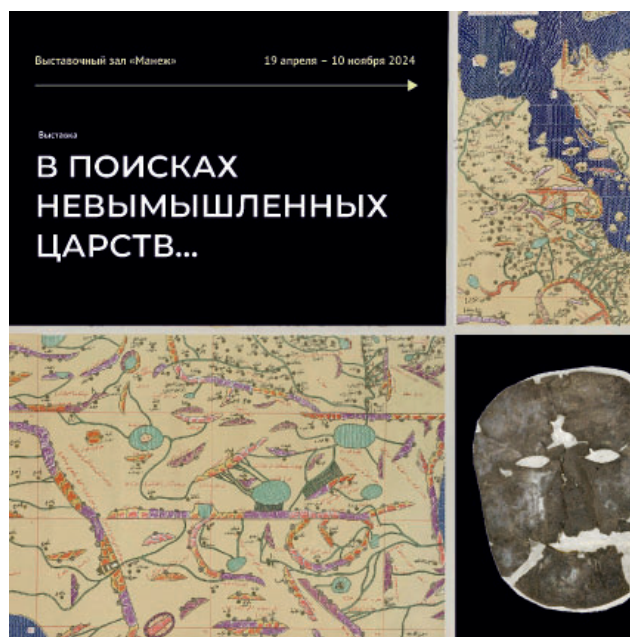
Рис. 6. Афиша выставки «В поисках невымысленных царств...» в Выставочном зале «Манеж» Казанского Кремля (18 апреля – 10 ноября 2024 г.)