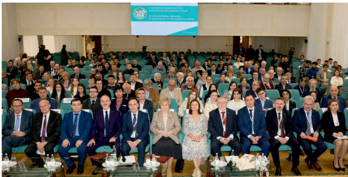
Рис. 5. Участники VI Международного конгресса евразийских степей, г. Казань, 29-31 октября 2024 г. Fig. 5. Participants of the VI International Congress of the Eurasian Steppes, Kazan, October 29-31, 2024

ся 29-30 октября в Академии наук Республики Татарстан (рис. 5). Традиция его проведения была заложена на Учредительном съезде Международного конгресса археологии евразийских степей в Казани в 2007 г., где было принято решение о создании новой научной организационной структуры, объединяющей и координирующей усилия археологов в изучении истории народов степей Евразии и сопредельных территорий. В работе конгресса приняли участие более 120 исследователей: ведущие российские и зарубежные ученые, специалисты по археологии и истории народов обширного пространства Степной Евразии с древности до Нового времени из 23 регионов России, руководители ведущих археологических институтов РАН и ученые из 9 зарубежных стран (Азербайджан, Болгария, Монголия, Казахстан, Кыргызстан, Турция, Узбекистан, Китай, Румыния).