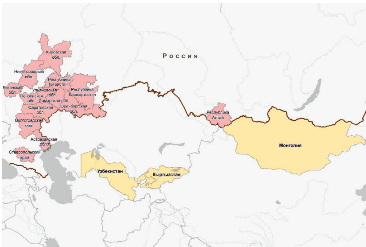
Рис. 4. Карта-схема с указанием географии археологических исследований, проведенных Институтом археологии АН РТ в 2024 г.