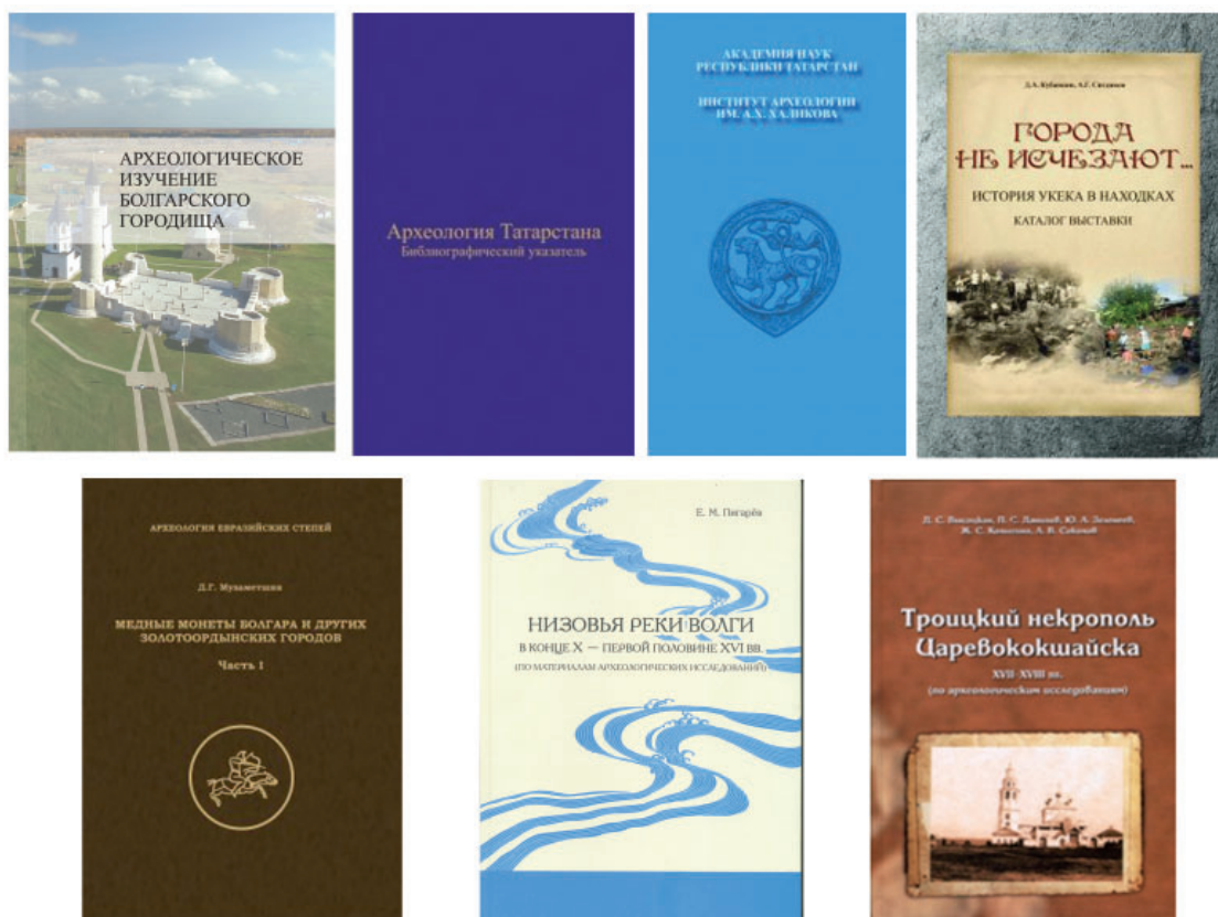
Рис. 1. Обложки монографий, опубликованных сотрудниками Института археологии имени А.Х. Халикова АН РТ в 2024 г.