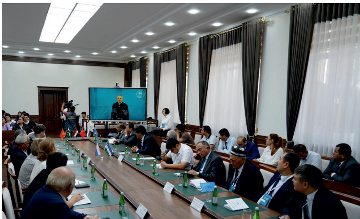
Рис. 9. Открытие второго этапа XI Международной археологической школы в Термезском государственном университете, г. Термез, Республика Узбекистан, 24 сентября 2024 г. Fig. 9. Opening of the second stage of the XI International Archaeological School at Termez State University, Termez, Republic of Uzbekistan, September 24, 2024

в которых приняло участие около 800 специалистов, студентов и молодых ученых из 42 стран.