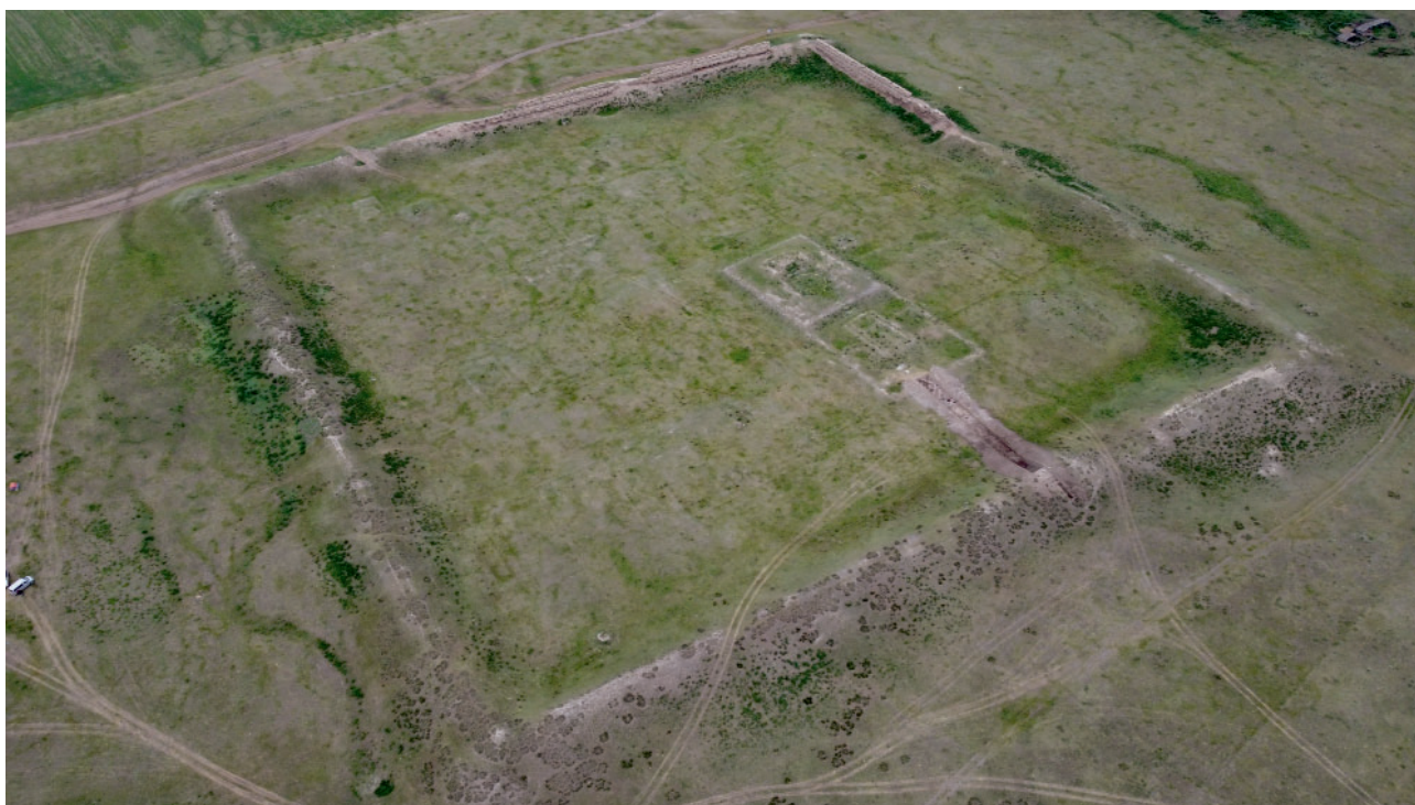
Рис. 8. Исследования северной столицы Уйгурского каганата – Бай-Балык (городище Бийбулаг), Монголия, июнь 2024 г.